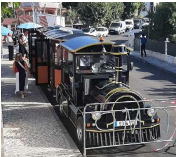
•Comboio turístico para uma volta à freguesia

Esta obra vem resolver definitivamente os constrangimentos de mobilidade, eliminando todas as barreiras de acesso aos serviços da Junta de Freguesia.