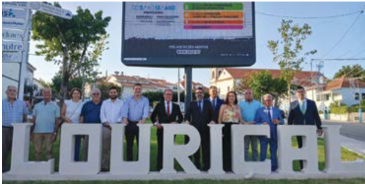
• Autarcas e convidados junto às letras que identificam a vila

Autarca acredita que o evento se consolidou Festas do Louriçal superaram todas as expectativas