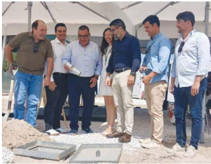
•Autarcas lançaram simbolicamente a primeira pedra da obra

A cerimónia contou com a participação dos três presidentes das freguesias que vão ser abrangidas por esta nova instalação que deixaram pala-