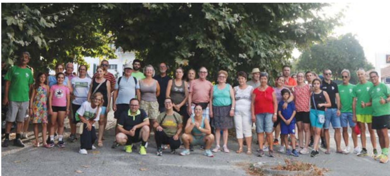
• Participantes da caminhada que decorreu ao final do dia 12, terça-feira, de forma a comemorar mais um aniversário

O Atlético Clube de Vermoil voltou a respeitar a sua data de fundação 12 Agosto de 1984, para assinalar os seus 41 anos. Apesar de ser um dia de semana, terça-feira, a colectividade que é uma das mais dinâmicas na freguesia, com presenças regulares em diversas provas de atletismo pelo país fora, reuniu