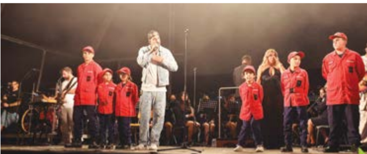
• A banda GNTK, que actuou no domingo com a Filarmónica, fez uma homenagem aos bombeiros