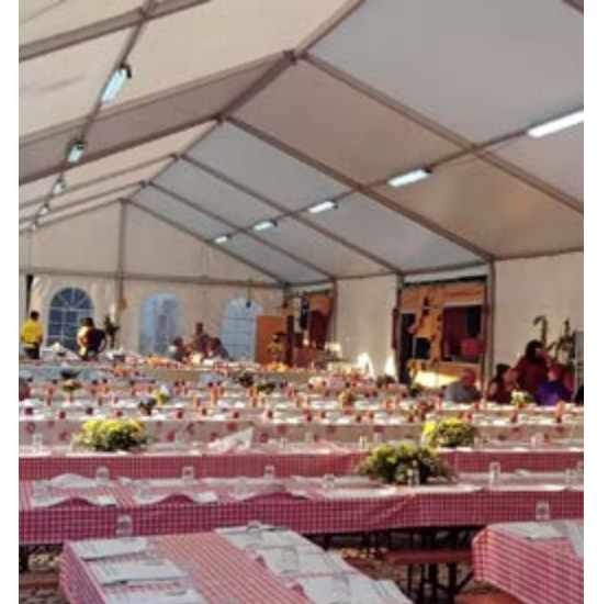
•Gastronomia representada pelas associações