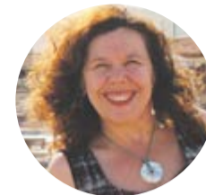
Por: Lidia Ribeiro