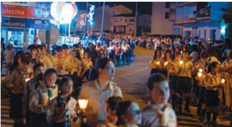
• A procissão de velas voltou a ser um dos pontos altos