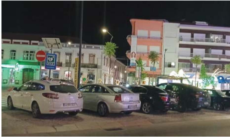
●A nova praça de táxis tem sido ocupada por outras viaturas durante a noite e fins-de-semana

Uma das maiores queixas que os taxistas têm com a deslocalização da praça prende-se com a ausência de telefone. "Cortaram o telefone quando fizeram as obras na avenida, mas estamos há cinco semanas no Cardal e ainda não foi repositado o serviço", diz um deles. Sem telefone, há muitos clientes que tentam contactar o serviço de táxis e não conseguem. "Tentam ligar até do Centro de Saúde e do Hospital e dá sempre interrompido", garantem. Mas se a falta de telefone é um problema, o abrigo parece ser outro. Só dá para duas pessoas se sentarem e praticamente não faz sombra. Por isso, nestes dias de calor, os taxistas acabam por ter de refugiar-se no outro lado da estrada, ao lado da igreja, onde ainda vai existindo