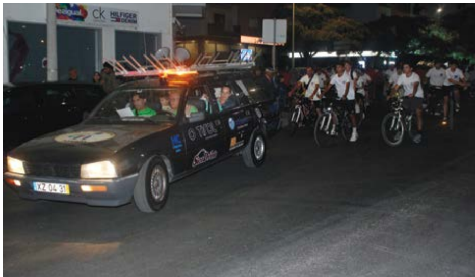
•O evento começou no horário previsto mas seria interrompido devido à chuva

Seguiu-se o habitual Passeio Noturno (apresentação das 14HP à cidade), tendo o animado pelotão percorrido as principais ruas da cidade, prolongando-se o passeio até ao Parque Verde do Açude,