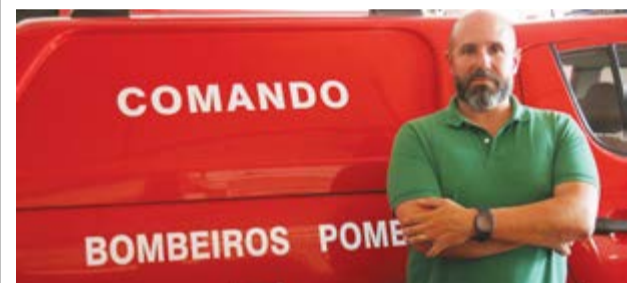
•Comandante elogia esforço dos bombeiros em assegurar serviços habituais com o combate aos fogos