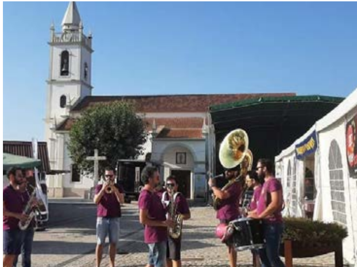
•Animação de rua junto aos stand's com produtos locais