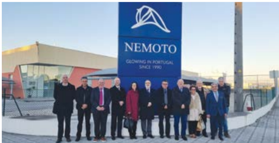
• Visita do clube rotário às instalações da Nemoto