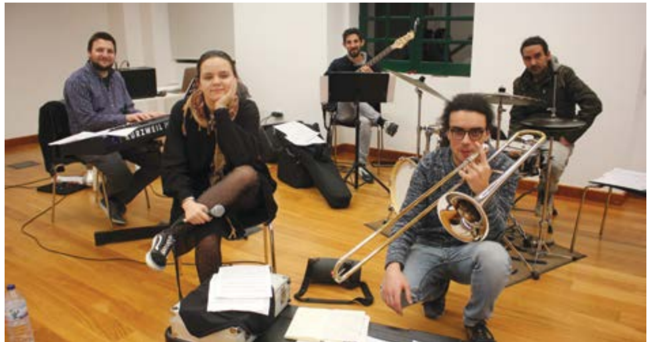
• Grupo fotografado durante um dos ensaios, na Casa Varela

-auditório do Teatro-Cine, a partir das 21h00. A iniciativa é dinamizada pelas Tertúlias do Marquês e terá entrada livre.