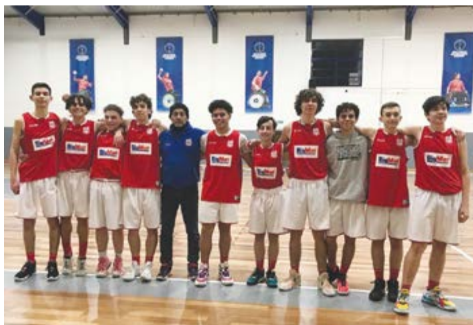
• A formação de Sub'18 masculinos soma oito vitórias consecutivas, jogando no próximo sábado, dia 24, no pavilhão de Albergaria dos Doze

Iniciaram a temporada com um terceiro lugar, tendo em seis jogos, somado quatro vitórias e duas derrotas, com os dois primeiros classificados do grupo, Stella Maris de Peniche e os Pimpões das Caldas da Rainha. Na segunda fase, foram enquadrados com o Sporting Clube Marinhense e a Associação Recreativa Amarense, tendo vencido todos os encontros, totalizando 319 pontos marcados e 150 sofridos. Agora, em mais um emparalhamento, o Núcleo de Pombal, venceu no passado dia 17, em Leiria, o Clube Basquetebol por 87-27. Para este sábado,