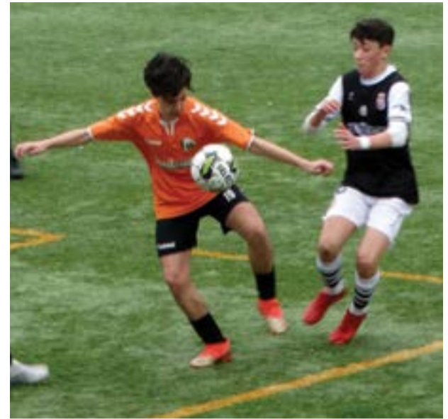
A Associação Desportiva Pedro Roma continua sem perder

Em iniciados, a Associação Desportiva Pedro Roma (ADP) continua a esgotar todos os adjectivos dada a sua hegemonia. Na época passada venceu tudo e actualmente, está no mesmo caminho. A equipa treinada por Caló é líder da divisão