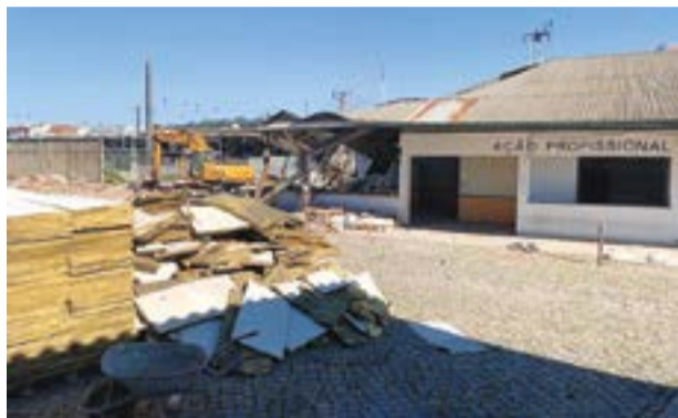
• Antigas instalações do centro de formação profissional da Cercipom já foram demolidas

em que se encontrava a área envolvente à central de camionagem faz parte do passado. As obras para