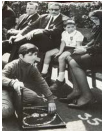
• Legenda: 10 de Junho O “Dia da Raça” era também o dia das lágrimas das famílias enlutadas que recebiam a condecoração póstuma num estojo de cartão

A atual situação russa em relação à guerra na Ucrânia, fez-me lembrar a situação que vivi na década de setenta do século passado e que resumi nos parágrafos anteriores, embora, naquele caso, os russos sejam os invasores, sem justificação racional. Mas, nos dois casos, os sistemas de governo não eram nem são democráticos, mas sim ditaduras em que os líderes, ou melhor os ditadores, impõem as suas ordens, de modo ditatorial sem que possa haver contestação.