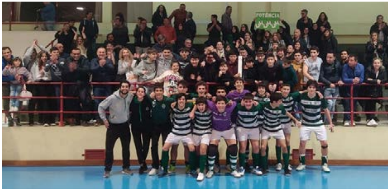
• No final, foi a foto de família como muita alegria estampada nos rostos. O Núcleo vai jogar a sua primeira final da Taça em juvenis

Nos escalões de formação, o Núcleo também vai esticando a corda e o esforço foi coroado esta temporada com a recente pas-