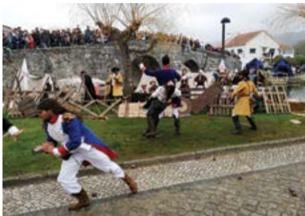
• A encenação histórica é um dos pontos altos do programa de dois dias