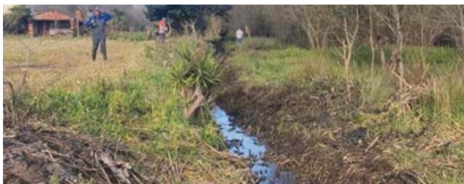
• Autarquia garante que os técnicos do Município estão a acompanhar a situação

Este “Inverno rigoroso, com um período intenso de chuvas,” fez com que “o