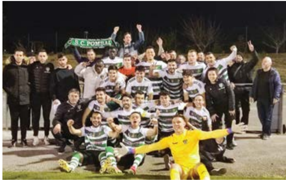
Num encontro realizado durante a noite, o Pombal foi mais feliz nos Marrazes

No escalão de séniores, o Sporting Clube de Pombal que na temporada passada foi finalista derrotado, após a marcação das grandes penalidades, garantiu o apuramento da mesma forma, no campo do Marrazes, para as meias finais da Taça.