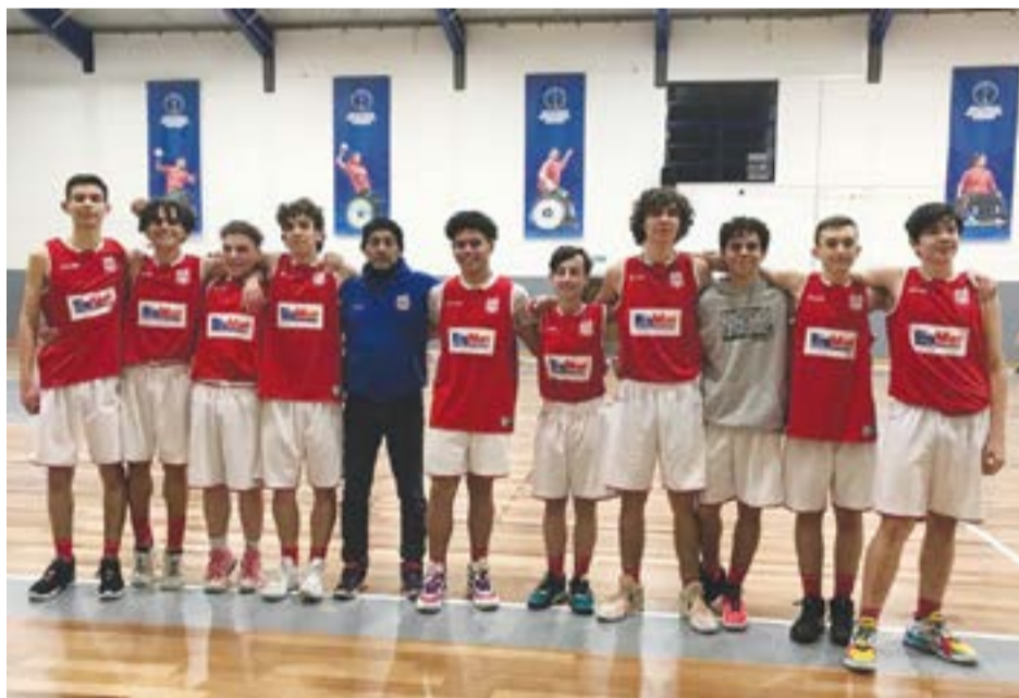
• A formação de Sub'18 masculinos soma oito vitórias consecutivas, jogando no próximo sábado, dia 24, no pavilhão de Albergaria dos Doze

Iniciaram a temporada com um terceiro lugar, tendo em seis jogos, somado quatro vitórias e duas derrotas, com os dois primeiros classificados do grupo, Stella Maris de Peniche e os Pimpões das Caldas da Rainha. Na segunda fase, foram enquadrados com o Sporting Clube Marinhense e a Associação Recreativa Amarense, tendo vencido todos os encontros, totalizando 319 pontos marcados e 150 sofridos. Agora, em mais um emparalhamento, o Núcleo de Pombal, venceu no passado dia 17, em Leiria, o Clube Basquetebol por 87-27. Para este sábado,