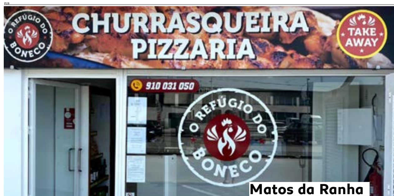
Matos da Ranha

Para mais informações, os interessados podem entrar em contacto com a organização através de btvvermoil@gmail.com ou 917 916 654.