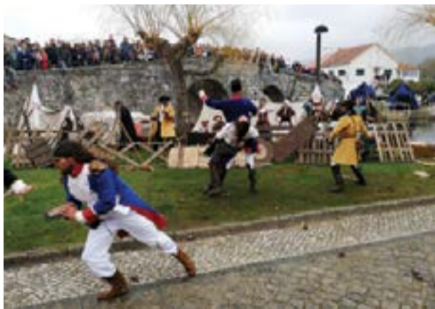
• A encenação histórica é um dos pontos altos do programa de dois dias