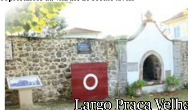
Largo Praça Velha