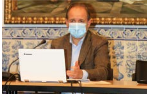
• Câmara tem feito briefings a dar conta da situação no concelho

O concelho de Pombal registava, esta segunda-feira, data de fecho da edição, um total de 230 casos activos de covid-19, sendo de realçar um aumento do número de recuperados para os 383. No total das 13 freguesias, a de Pombal é a que regista mais infectados, com os dados da Autoridade de Saúde Local a darem conta de 124 casos activos neste território. Dados que resultam do facto de ser nesta freguesia que estão concentrados os surtos ocorridos no lar residencial da Cercipom, onde 27 pessoas testaram positivo há cerca de uma semana (cinco colaboradores já recuperaram entretanto, mas há a lamentar também um óbito), e no bairro Margens do Arunca, detectado há aproximadamente duas semanas, e que atingiu 47 cidadãos ali residentes.