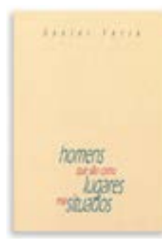
João de Barros pode ser visto no Padrão dos Descobrimentos em Lisboa. Primeira edição do livro de Daniel Faria editado pela Fundação Manuel Leão (1998).

“Homens que são como lugares mal situados Homens que são como casas saqueadas Que são como sítios fora dos mapas Como pedras fora do chão Como crianças órfãs Homens agitados sem bússola onde repousem Homens que são como fronteiras invadidas Que são como caminhos barricados Homens que querem passar pelos atalhos sufocados Homens sulfatados Por todos os destinos Desempregados das suas vidas Homens que são como a negação das estratégias Que são como os esconderijos dos contrabandistas Homens encarcerados abrindo-se com facas Homens que são como danos irreparáveis Homens que são sobreviventes vivos Homens que são sítios desviados Do lugar”