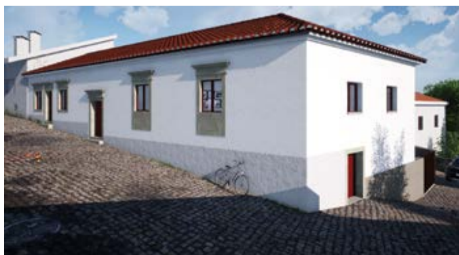
Em fase de restauro está o Celeiro. Um investimento da junta com o apoio da autarquia