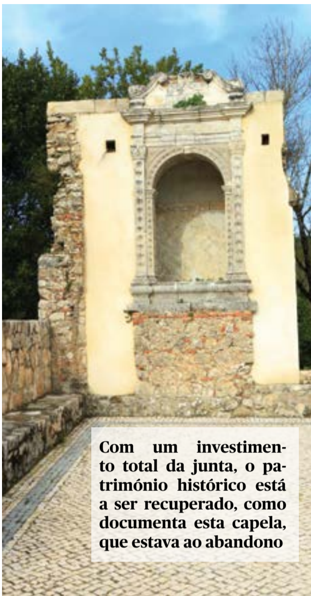
Com um investimento total da junta, o património histórico está a ser recuperado, como documenta esta capela, que estava ao abandono

Nicho Seiscentista: Construído em meados do século XVI, data provável da fundação da capela em que se encontrava inserido, terá pertencido ao Palácio de André da Silva Coutinho e mais tarde aos Duques de Aveiro. Exemplar de arquitectura religiosa, apresenta características de estilo maneirista