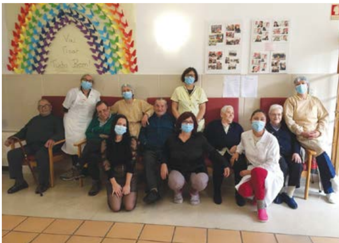
• Grupo de utentes e colaboradoras

Nesse historial de duas décadas destacam-se, a título de exemplo, a formação em informática e inglês para jovens ou a atribuição de bolsas de estudo. Das que ainda se mantêm, a presidente do Conselho de Administração realça o trabalho realizado na Escola da Música de Abiul, destinada à formação musical de jovens. Na linha dessa preocupação, “as iniciativas promo-