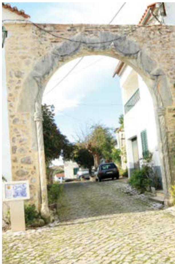
Arco Manuelino: Edificado entre os finais do século XV e os inícios do século XVI. Este arco de características manuelinas é um dos elementos que resta do palácio de André da Silva Coutinho. Posteriormente, viria a ser a entrada para o Paço dos Duques de Aveiro, proprietários da vila até ao século XVIII

Nicho Seiscentista: Construído em meados do século XVI, data provável da fundação da capela em que se encontrava inserido, terá pertencido ao Palácio de André da Silva Coutinho e mais tarde aos Duques de Aveiro. Exemplar de arquitectura religiosa, apresenta características de estilo maneirista