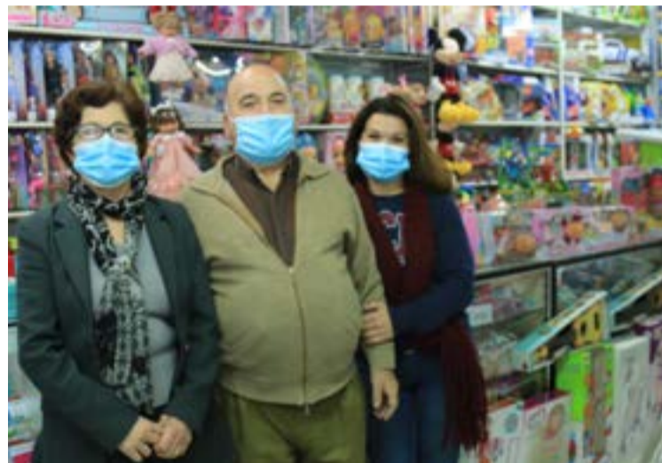
• Na Casa Bébé, os proprietários mantêm-se otimistas para esta quadra