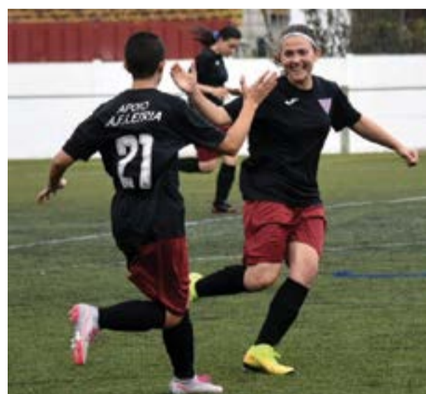
● O Desportivo da Ilha realiza o jogo da Taça no dia 27 Dezembro