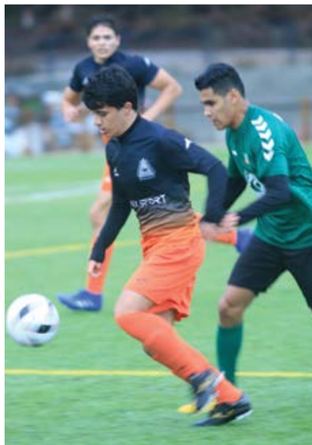
• Equipa que defrontou a Académica de Coimbra no passad