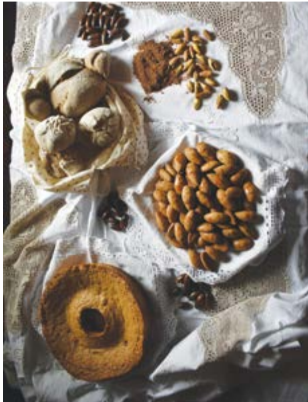
• As lesmas de bolota foram uma das atracções da iniciativa

Através dos canais digitais do município, foram