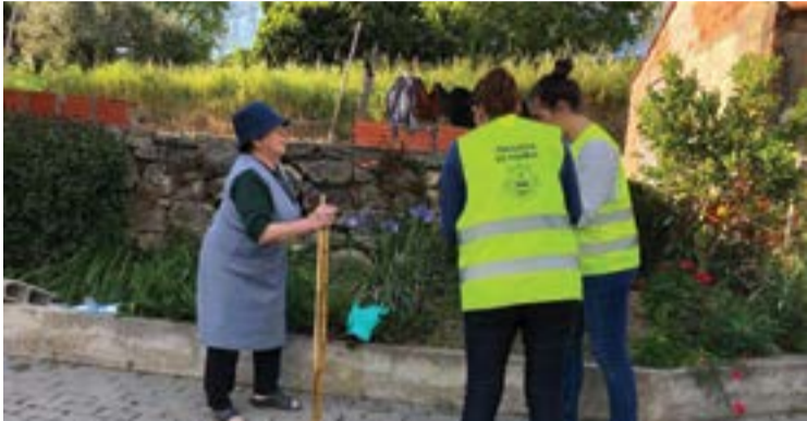
Com o apoio de voluntários, a junta distribuiu milhares de máscaras sociais

A Junta de Freguesia de Pombal anunciou o reforço das medidas de apoio social a agregados familiares mais vulneráveis e a idosos em situação de isolamento. Uma medida desenvolvida em cooperação com as autoridades competentes e que pretende ajudar a travar a evolução de casos activos que se tem verificado na freguesia.