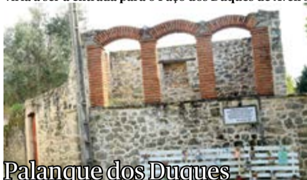
Palanque dos Duques