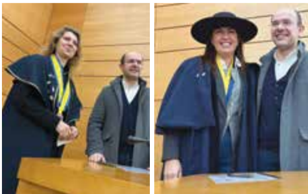
• Confraria da Ferradura e do Bodo na assinatura dos protocolos