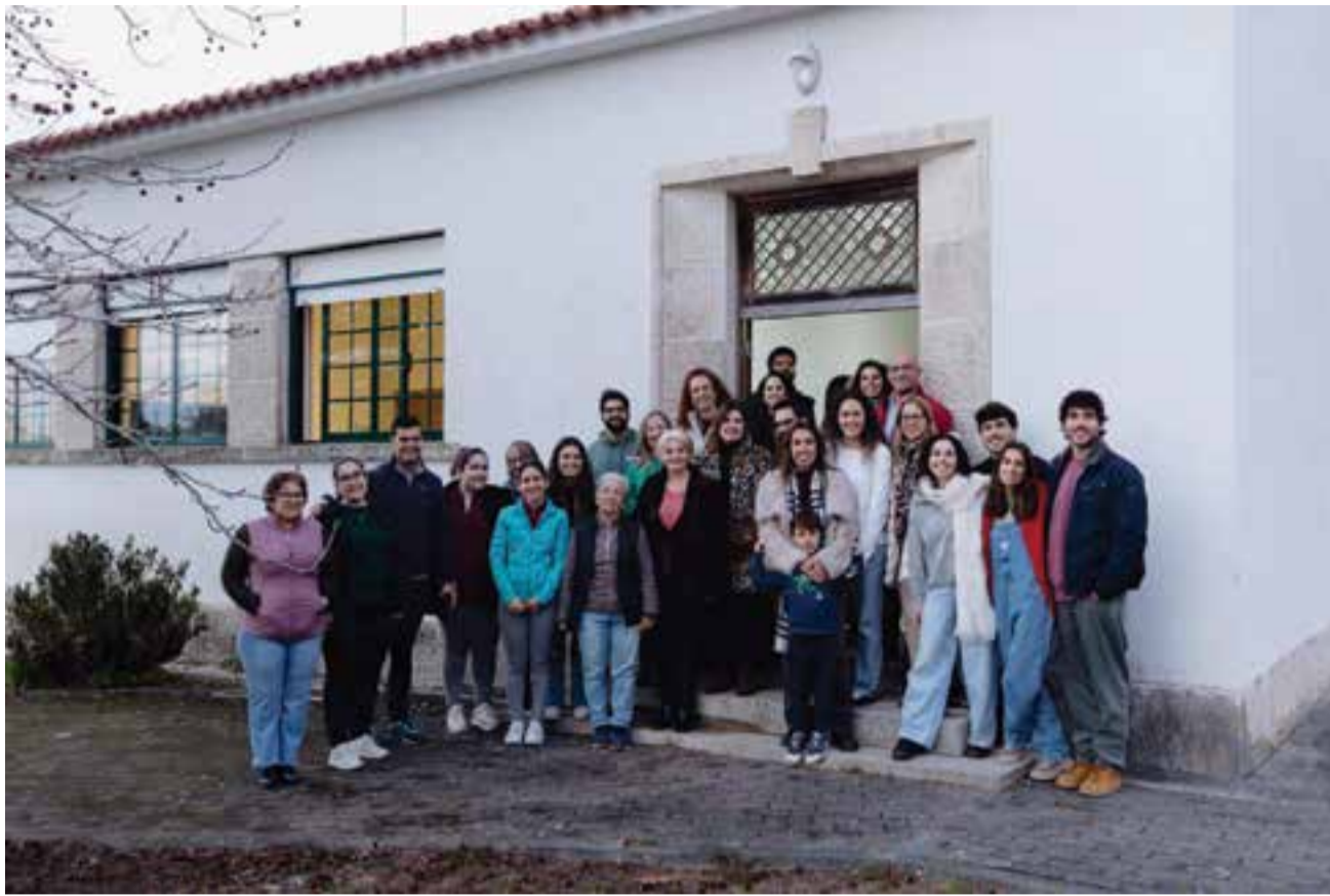
Antiga Escola Primária de Barbas Novas (Almagreira) volta a receber crianças

Da soma dessas vivências nasceu a vontade de procurar outras respostas. "Começámos a investigar outros métodos educativos", recorda. O caminho, porém, revelou-se tudo menos simples. Em Portugal, os projectos educativos fora do mode-