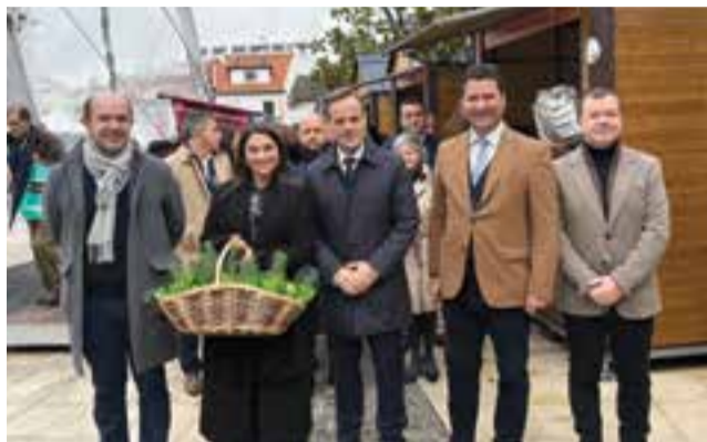
• As entidades na visita aos satand's