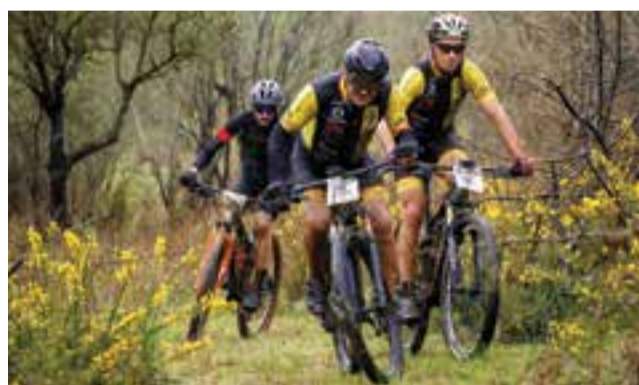
• O percurso terá aproximadamente 37 km's

Fiel às suas origens, esta sétima edição, será de andamento livre e proporcionará interessantes desafios, paisagens maravilhosas e momentos de elevada satisfação, com destaque para o reforço sensível-