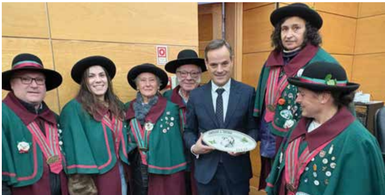
• A Confraria do Tortulho de Vila Cã aproveitou a oportunidade para entregar uma lembrança ao presidente da Câmara Municipal Ansião

Assinatura de um protocolo de cooperação entre a Associação de Desenvolvimento Terras de Sicó e seis confrarias da região marcou a abertura da edição deste ano da Feira dos Pinhões, em Ansião, assumindo-se como um dos sinais mais claros da estratégia que o novo executivo municipal pretende imprimir à promoção do território e dos seus produtos endógenos.