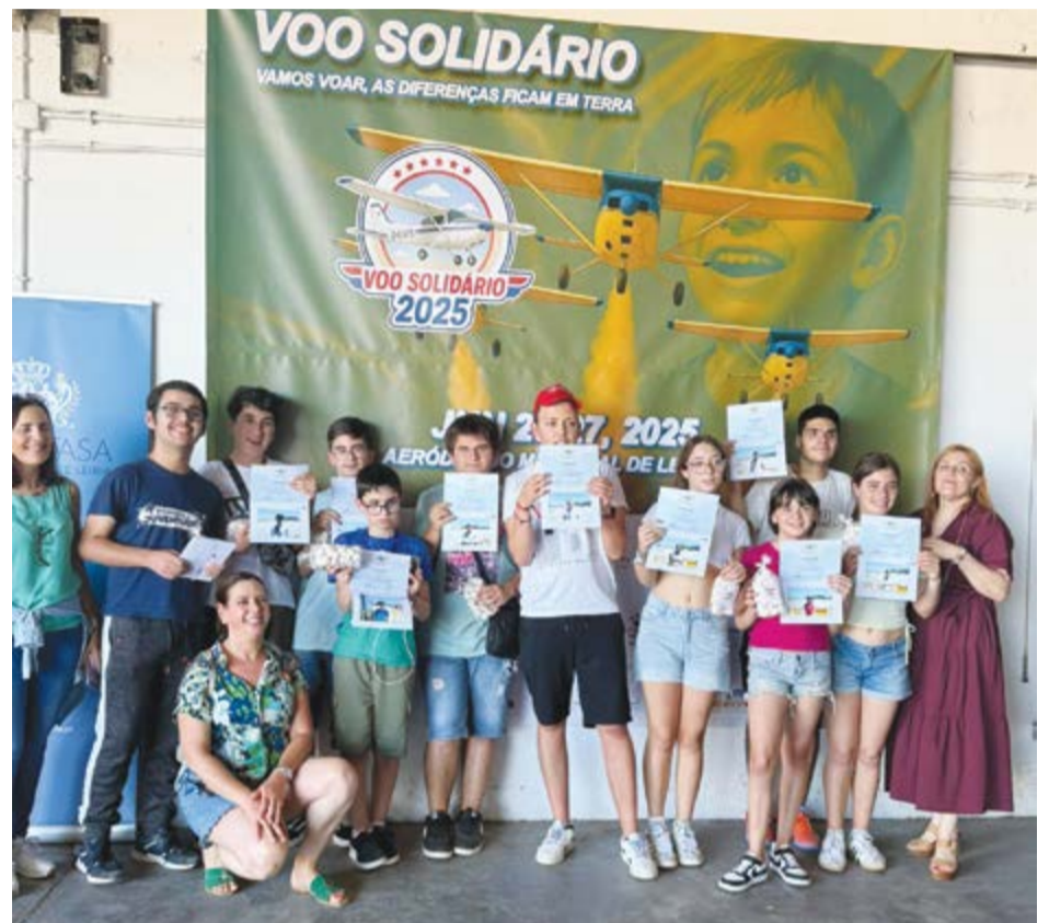
• Alunos de escolas de Pombal usufruíram de baptismo de voo

Do concelho de Pombal estiveram participantes da APEPI, Cercipom, e escola de Pombal.