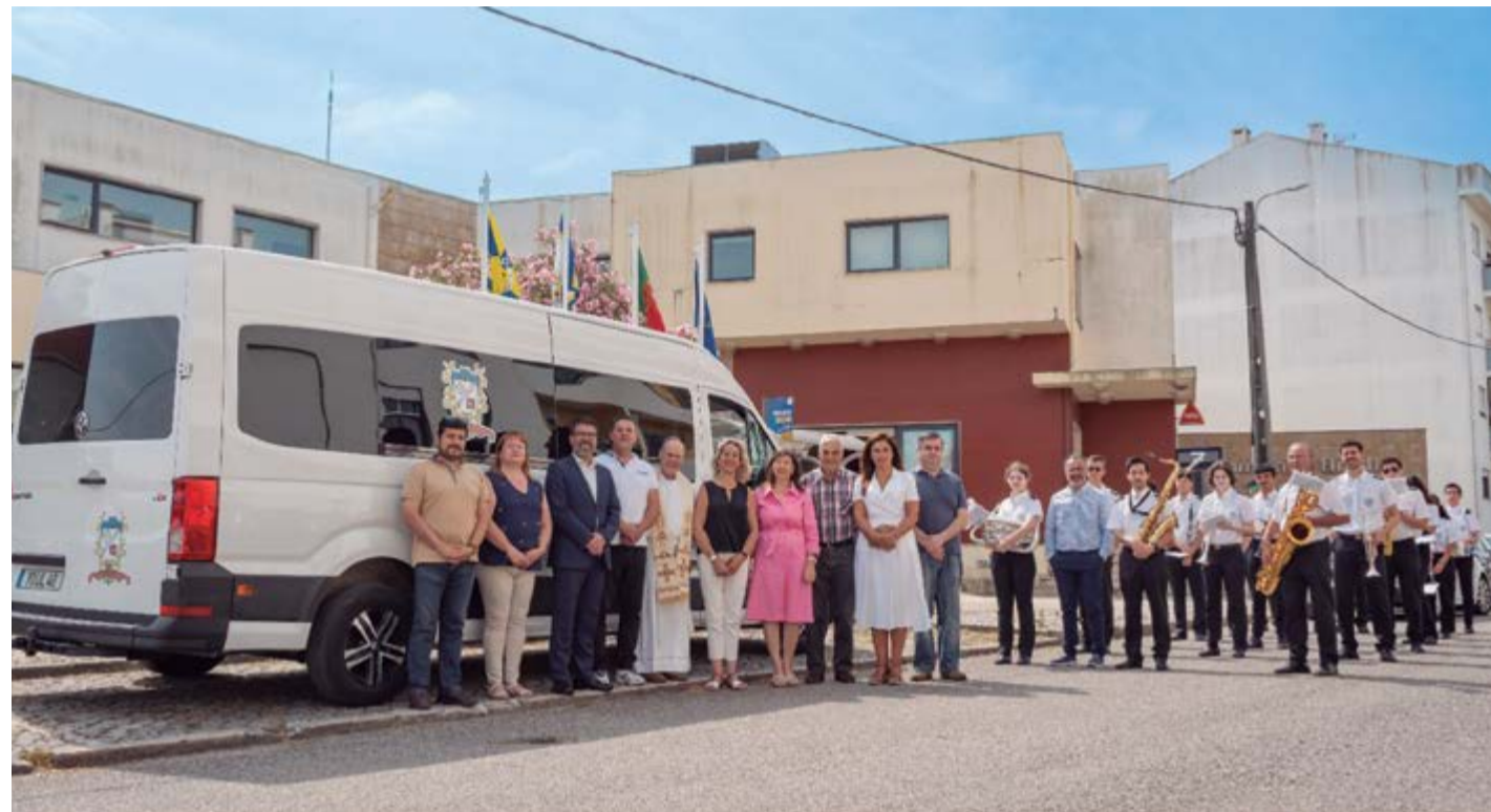
• Directores, músicos e autarcas junto à carrinha benzida pelo pároco de Pombal

A Associação Filarmónica Artística Pombalense (FAP) já adquiriu a tão desejada viatura para transporte de músicos, instrumentos e materiais.