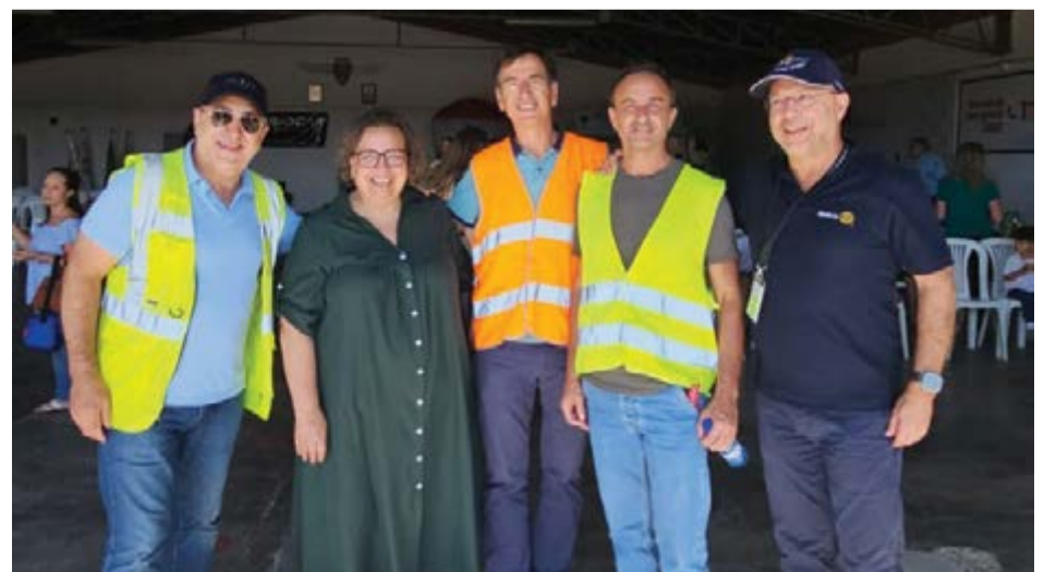
• Elementos da organização no aeródromo de Leiria