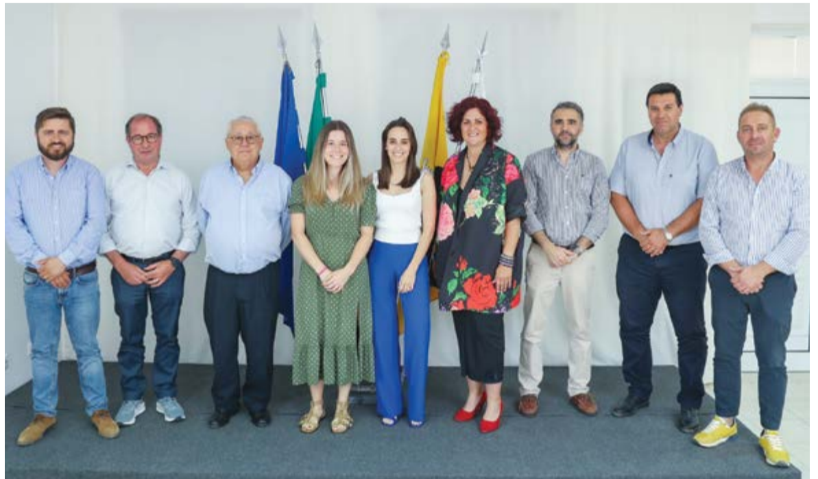
●Presidente da Junta do Louriçal (segundo a contar da esq.) é um dos fundadores da associação

Com arrozais que se estendem do Mondego ao mar, um património vivo de barcas, salinas, pesca artesanal e termas, o território agrícola entre a Figueira da Foz, Pombal e Soure quer deixar de ser periferia e passar a ser uma referência nacional na produção e no turismo rizícola. Para isso, o primeiro passo já foi dado, ao ser criada, no dia 24 de Junho, a Associação de Freguesias do Vale do Pranto, da qual fazem parte Samuel, Louriçal, Vinha da Rainha, Alquei-