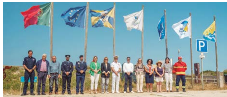
• Momento do hastear das bandeiras pelas entidades oficiais

os certificados alusivos à actividade de “Mensagens de Sensibilização Ambiental”, integrada no Programa de Actividades de Educação Ambiental do Programa Bandeira Azul 2025, e este ano sobre o tema “Restauro da Natureza”.