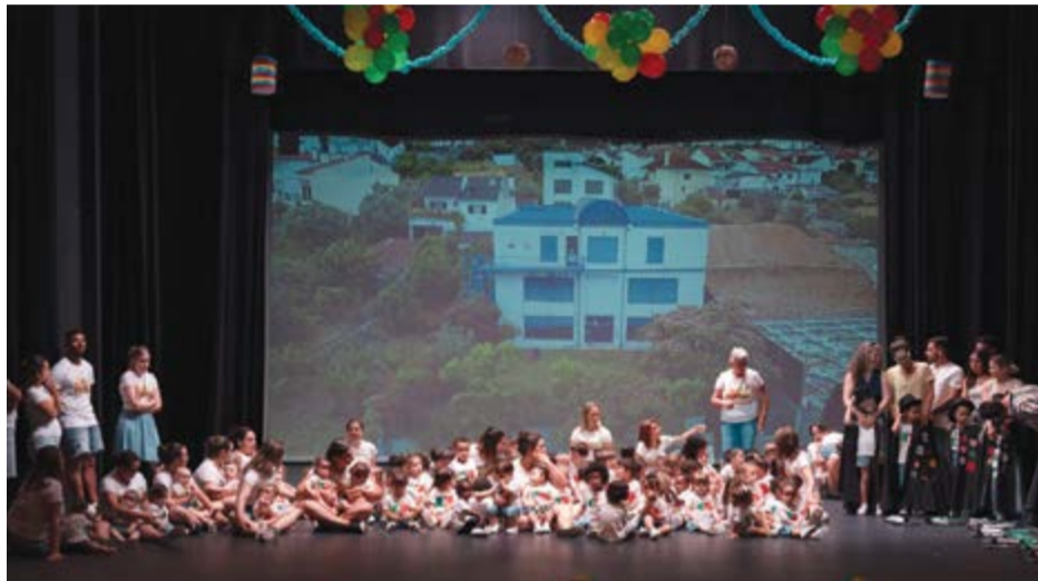
●Alunos, docentes e auxiliares no final da festa