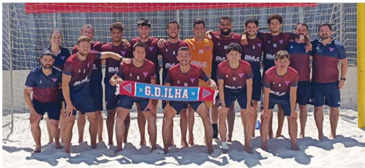
• A formação do Grupo Desportivo da Ilha continua com um bom desempenho rumo à segunda fase

vez, na primeira divisão, em que a Associação do Lourçal se tem estado a reforçar, começará no fim-de-semana de 3 e 4 de Outubro.