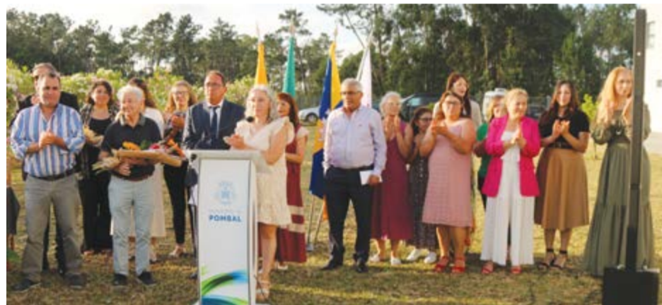
• Direcção e colaboradores do Lar da Felicidade