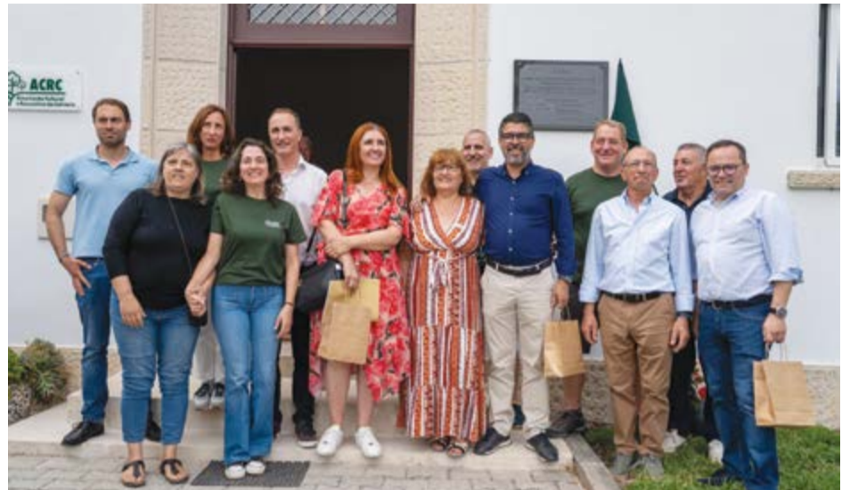
•Dirigentes e autarcas de Pombal e Vermoil junto à antiga escola primária