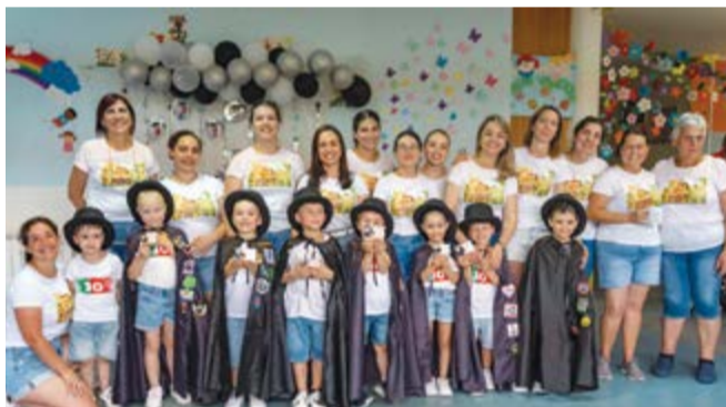
●Grupo de finalistas com as docentes e auxiliares