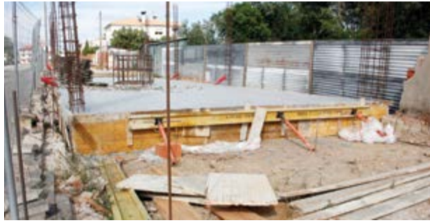
● Populares denunciam a retirada de lancis do passeio, junto à obra

A edificação de duas moradias, na Rua do Comércio, em Meirinhas, está a gerar uma onda de contestação por parte dos populares, que exigem que a obra seja embargada, por não cumprir a legislação em vigor. Na sequência deste descontentamento, está a circular bum abaixo-assinado, promovido por um grupo de cidadãos da freguesia, proprietários dos terrenos confinantes, que alegam que a obra, licenciada pelo Município de Pombal e a construir "numa faixa diminuta da antiga Estrada Nacional 1 (actual Rua do Comércio), é um atentado contra a população". Nessa medida, pretendem que "seja cancelada" e já entre-