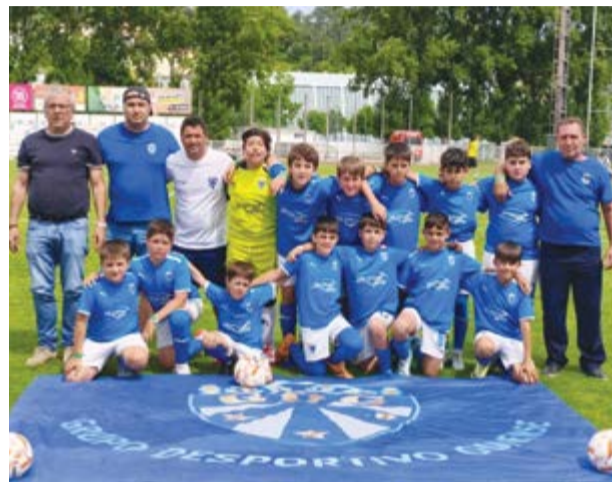
• O Guinense chegou à final no escalão de Sub'11

Por último, nos infantis, divisão em dois quadros competitivos, com o Barreirense a triunfar no escalão de futebol de sete, após 6-1, frente ao Marrazes, enquanto o Cartaxo derrotava o União de Pombal por 1-0, com o golo a surgir aos 22 minutos. Na presente edição, a organização que foi da responsabilidade da União de Pombal que substituiu a Associação Desportiva Pedro Roma, abdicou do futebol feminino e dos Sub'14, ficando o futebol de