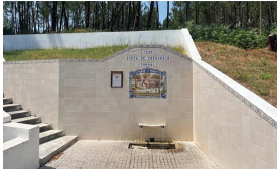
•A Fonte da Charneca apresentava muitas vezes resultados não conforme