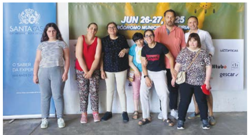
• A Cercipom marcou presença no evento