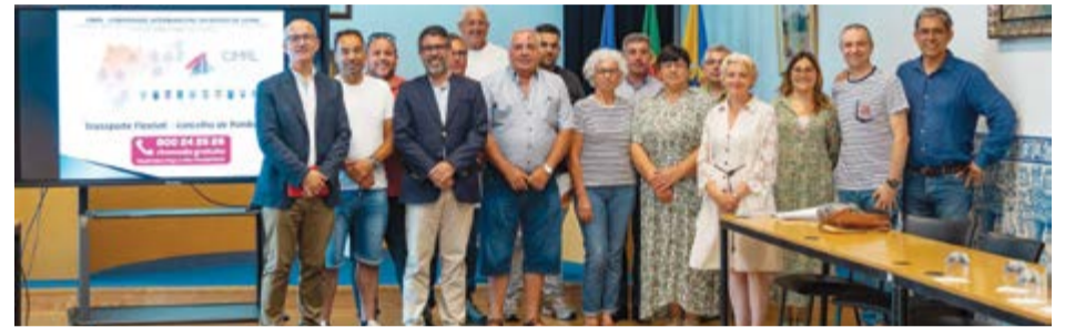
Os protocolos foram assinados entre a CIMRL, Município e taxistas

fazer dentro do concelho". O Secretário da CIMRL revelou ainda que, em breve, será possível realizar deslocamentos entre Pombal e Leiria ou Coimbra através de um serviço partilhado com as respectivas comunidades intermunicipais.