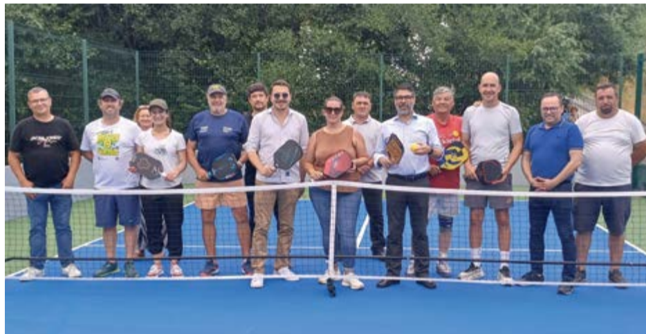
•Autarcas e convidados estrearam-se na modalidade

A ideia de fazer o primeiro campo de pickleball em Carnide partiu da própria junta de freguesia. O local onde está implementado, no Parque Ribeirinho, estava