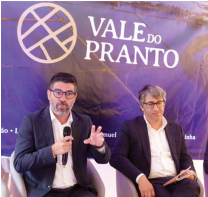
●Presidente da Câmara de Pombal disse que o projecto está em consonância com a estratégia do município