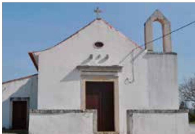
• Conjunto de esculturas é considerado relevante pela sua coerência, qualidade artística e enquadramento histórico

A decisão consta de uma portaria publicada a 6 de Janeiro, em Diário da República, e resulta de um processo de classificação promovido pela Museus e Monumentos de Portugal. Em causa está um conjunto de esculturas datadas entre os séculos XV e XVIII, considerado relevante pela sua coerência, qualidade