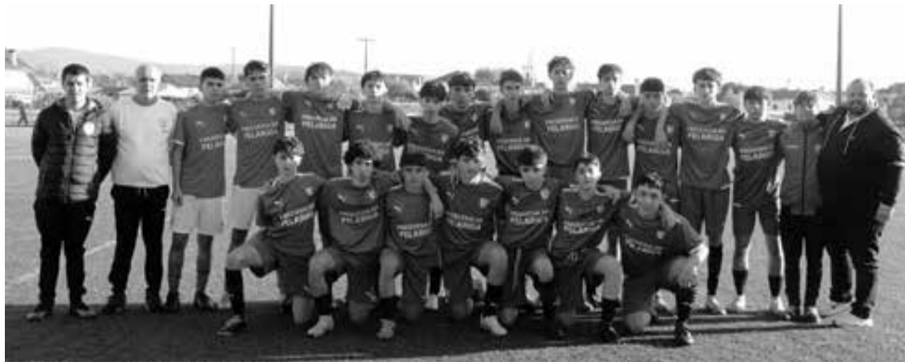
• A pedido da Academia Happyball, o jogo de juvenis da Pelariga foi adiado para 21 de Fevereiro

Está de volta o futebol distrital com todos os escalões em actividade.