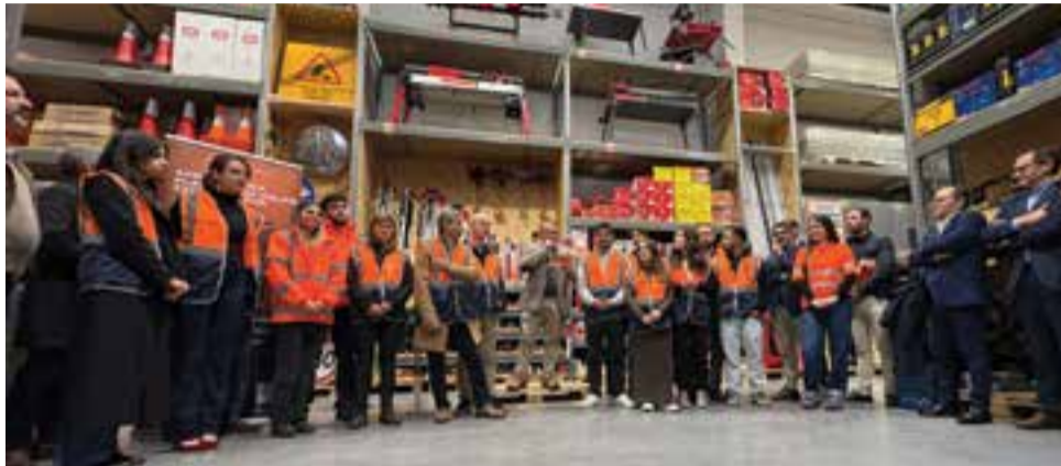
• Durante a cerimónia todos os colaboradores foram chamados para a apresentação

A Ponto+ assume-se como uma evolução do conceito anterior, diferenciando-se pelo foco no serviço e na rapidez de resposta. “Distinguímo-nos pelo nosso foco no serviço e agilidade. A nossa abordagem não é apenas transaccional”, explica o responsável, sublinhando que o ob-