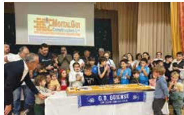
• A colectividade assinalou os 51 anos no feriado de 8 de Dezembro

A finalizar, um agradecimento aos patrocinadores, num total de 80, que sem eles era impossível fazer o trabalho que estamos a executar».