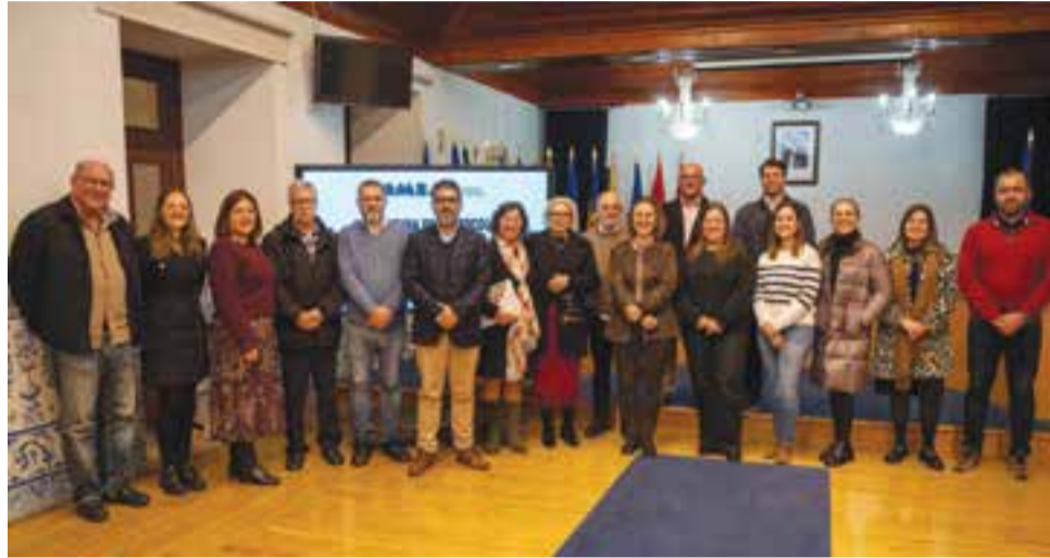
• Autarcas e representantes das instituições no dia da assinatura dos acordos de gestão

Na cerimónia, o presidente da Câmara destacou a "importância da força da sociedade civil no nosso concelho, da força da nossa rede social, o que nos conduz para uma maior coesão territorial", sublinhando o "trabalho notável" que