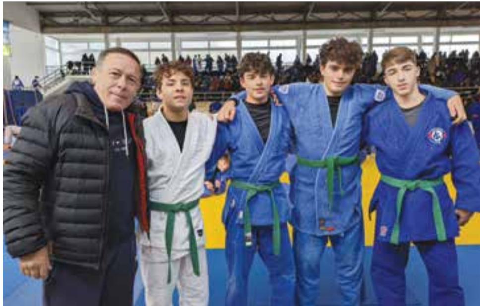
• Os atletas tiveram bons desempenhos e puderam obter alguns pontos para o ranking individual

Open decorreu no Pavilhão Municipal de Gois