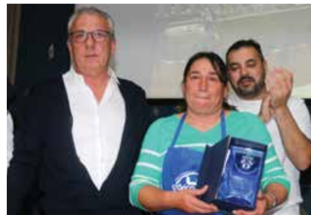
• Os colaboradores também foram distinguidos pelo presidente