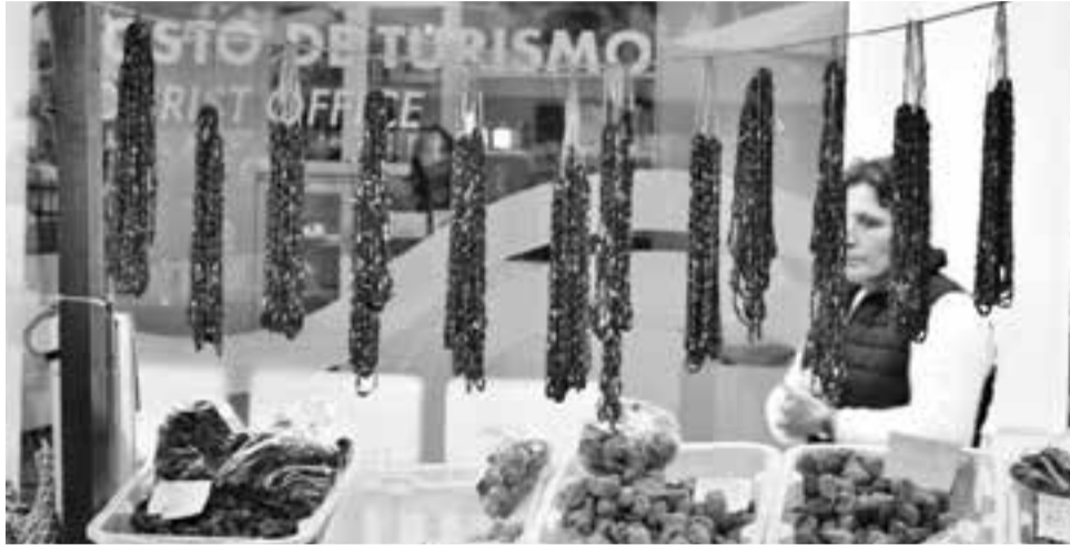
• A feira contará com um forte envolvimento de produtores locais, expositores e associações, mantendo a ligação à identidade do território

A feira contará com um forte envolvimento de produtores locais, expositores e associações, mantendo a ligação à identidade do território. No sábado, está prevista uma reunião que juntará confrarias da região de Sicó, com a assinatura de