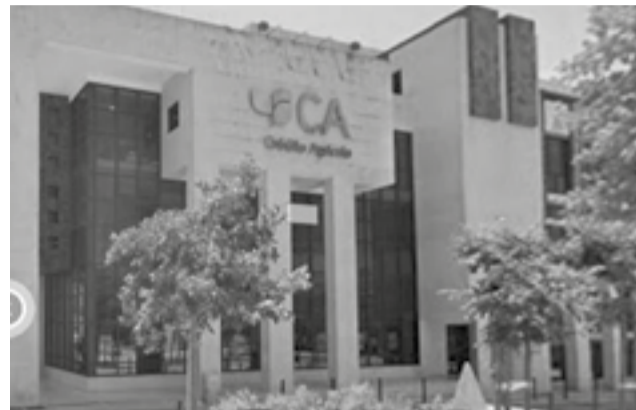
•A Caixa Agrícola Centro Litoral tem sede na cidade de Pombal