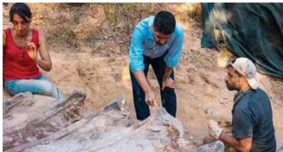
A jazida de Monte Agudo situa-se muito perto de duas localidades com fósseis do final do Jurássico já bem conhecidos: as jazidas da Junqueira e de Andrés

os trabalhos têm contado com a colaboração de paleontólogos portugueses e espanhóis, que se encontram a estudar