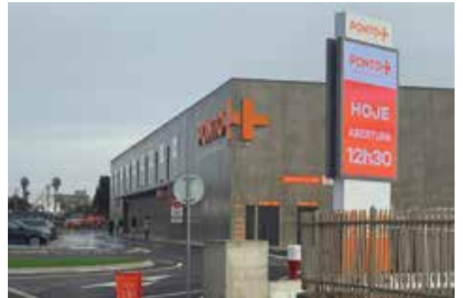
• Localiza-se junto ao IC2 em Outeiro da Ranha