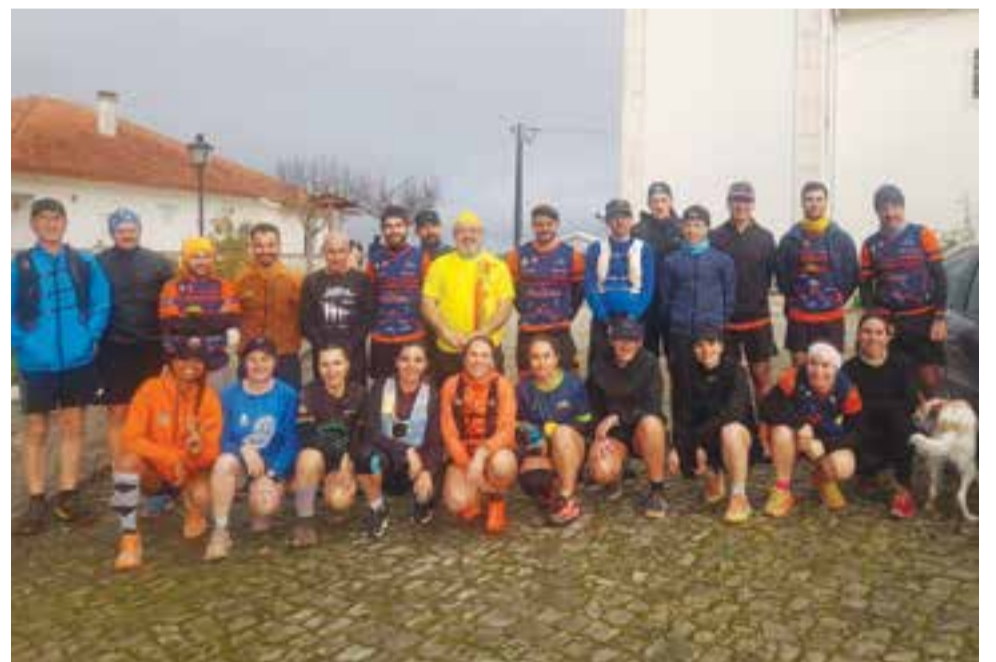
• Participantes na iniciativa solidária

O Vilaventura promoveu, no passado dia 11, a 4.ª Feira Louca – Especial 2.º Aniversário, uma iniciativa solidária que juntou cerca de 40 participantes em Vila Cã. O evento incluiu um treino-convívio realizado nos trilhos do circuito Vila-