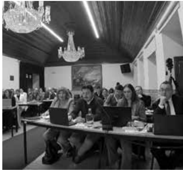
• A sessão da Assembleia Municipal decorreu a 22 de Dezembro

Na saúde, o orçamento contempla 9,2 milhões de euros em 2026 e 12,3 milhões até 2030, com forte apoio de financiamento do PRR. Para o presidente da Câmara, Pedro Pimpão, trata-se do “maior investimento dos últimos anos nesta área.” Para o município, o investimento nesta área concretiza “uma das maiores transformações do concelho, com mais cuidados de proximidade