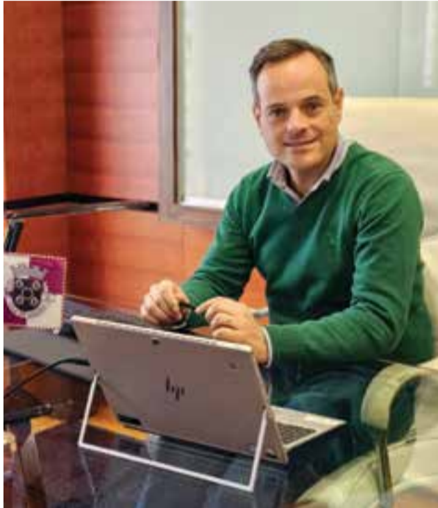
• Durante a entrevista, o presidente deu conta de que a autarquia tem “edifícios públicos que ainda nem são propriedade do Município”

JC — A diferença nota-se, desde logo, numa verba de quase meio milhão de euros para projectos, no sentido de preparar intervenções que não estavam previstas. Um exemplo é a rede viária: identificámos necessidades, mas não existiam projectos actuais. Sem projecto não se pode avançar para obra. Outro caso é a Escola Básica n.º 2 de Avelar: há financiamento pendente, mas o projecto terá de ser revisto porque não estava