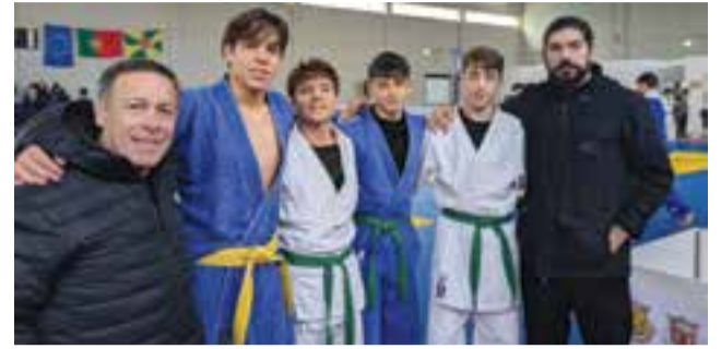
• A escola de Pombal esteve com um grupo de quatro atletas

Estão, pois de parabéns os judocas da Escola de Judo de Pombal por esta honrosa participação.