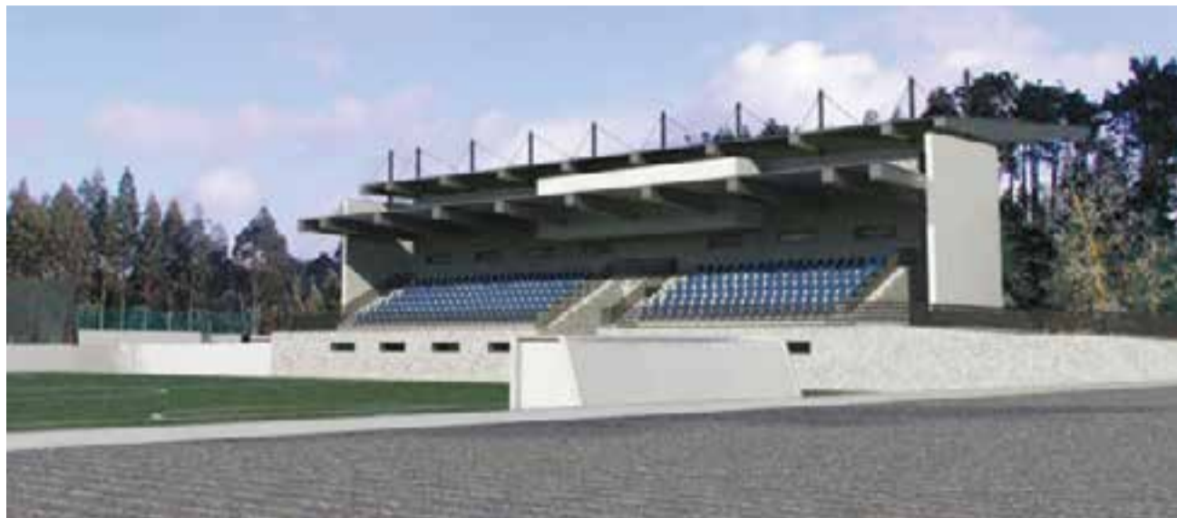
• A obra será faseada e terá os lugares necessários para acolher finais distritais