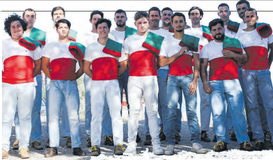
• Pretende-se angariar fundos para apoiar as vítimas da tempestade de Abiúl

A decisão de avançar com o evento surgiu de forma espontânea, durante um treino conjunto realizado no início