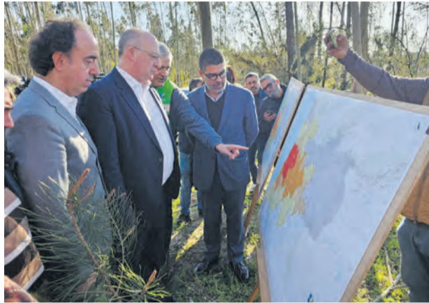
● Em visita a Pombal, ministro da Agricultura e Pesca, José Manuel Fernandes, anuncia apoio de 40 milhões de euros para recuperação da floresta

Os dados foram avançados pelo presidente da Câmara Municipal de Pombal, Pedro Pimpão, à margem de uma visita aos trabalhos de recuperação na freguesia da Guia, onde sublinhou a dimensão “muitíssimo grande” da intervenção em curso, marcada pe-