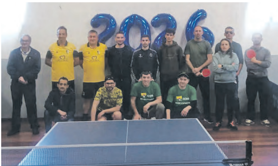
• 11 associações marcaram presença na abertura das Louriçalíadas

Realizou-se a primeira actividade de mais uma edição das Louriçalíadas com organização da Junta de Freguesia do Louriçal e das associações participantes. Na colectividade da Torneira e Serrião, decorreu o ténis de mesa com a presença das Matas, Casal da Rola, Torneira e Serrião, Associação do Louriçal, PikNik, Foitos, Antões, Valarinho, Cas-