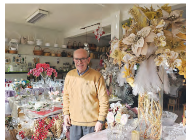
• Sr. Casinha é a imagem de marca do espaço

Quarenta anos depois da sua fundação, “A Casinha” entra em mais uma estação com a mesma essência de sempre: um espaço onde tradição e actualidade se encontram, e onde cada visita pode transformar-se numa pequena descoberta.