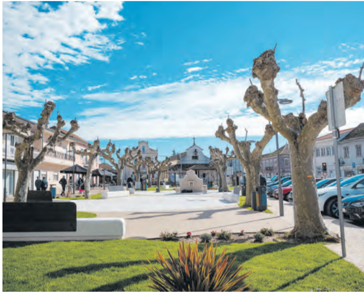
● Largo do Rossio, na Guia, acolhe Mercado de Páscoa

Associações, artistas, artesãos e comerciantes são desafiados a apresentarem as suas ideias e projectos à Junta de Freguesia, que tem as inscrições abertas para expositores. As mesmas podem ser feitas presencialmente, por mail ( geral@jf-guia.pt ) ou telefone (236 950 920 /