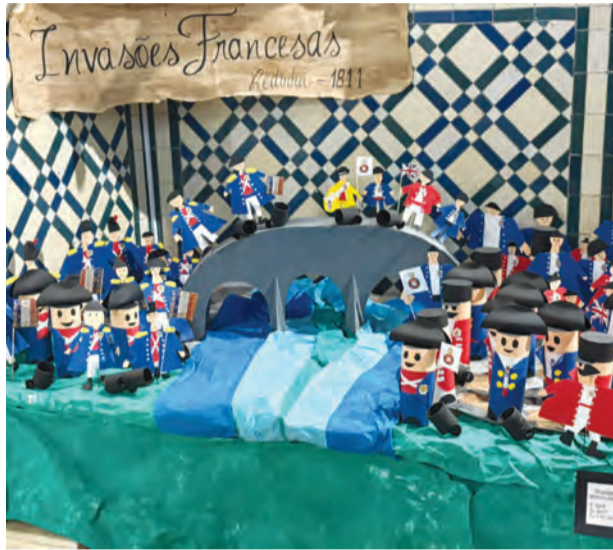
• Trabalhos foram realizados pelos alunos Escola Básica da Redinha

A iniciativa resultou de um trabalho criativo das crianças, que recriaram, através de trabalhos manuais, diferentes elementos associados à 3.ª Invasão Francesa, com especial enfoque nos acontecimentos que marcaram a Redinha. Entre as peças apresentadas estiveram representações de soldados e cenários históricos, elaborados com