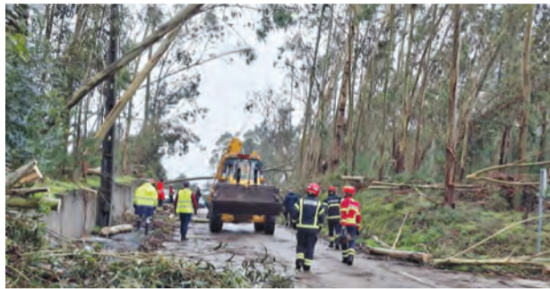
●Geradores e operações no terreno explicam aumento dos gastos em combustíveis

O procedimento surge após o consumo já ter sido efectuado, enquadrando-se no regime ex-