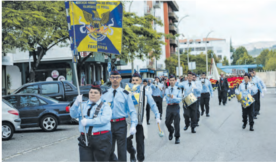
● A Fanfarra dos Bombeiros Voluntários de Pombal conta actualmente com 11 elementos, mas os responsáveis apontam a um crescimento até aos 25 executantes