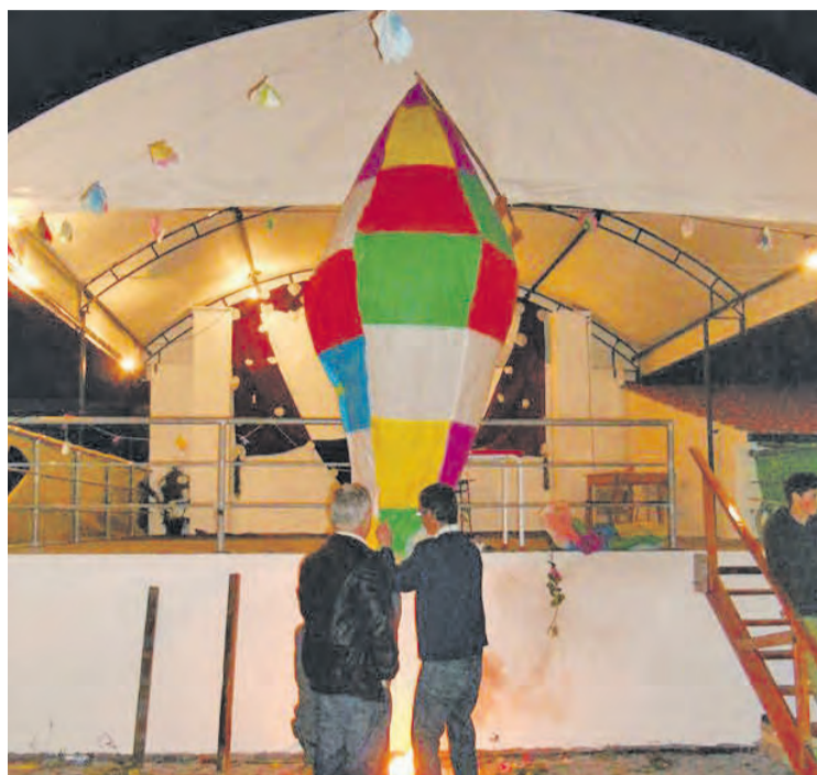
● Lançamento do Balão é um dos pontos altos das celebrações da Páscoa, na Cartaria

Com raízes num tempo em que os rapazes eram chamados à inspecção militar, cabendo-lhes a responsabilidade de organizar os festejos, a dinâmica mantém-se até hoje, ainda que adaptada aos tem-