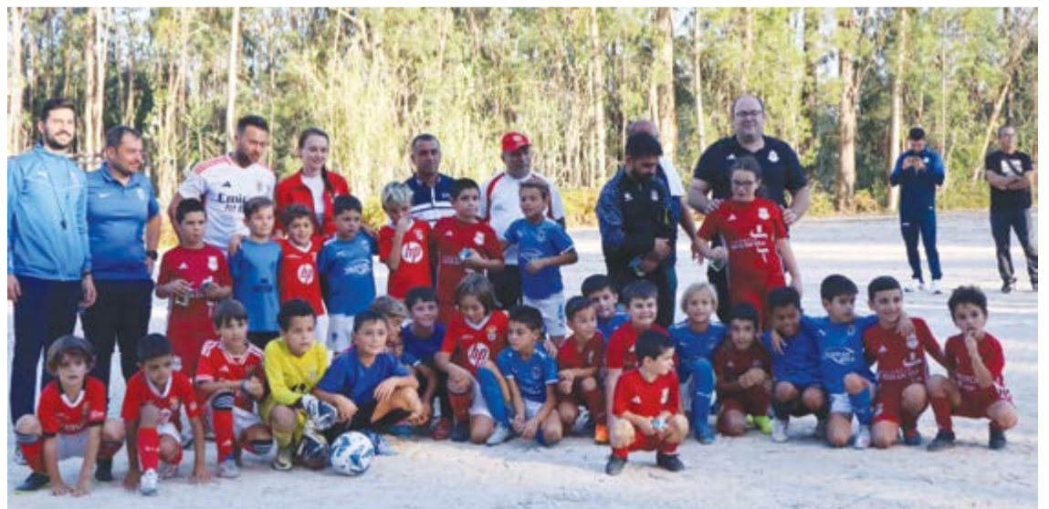
•Benfica Escola Leiria, Matamourisqueense e Guiense fizeram parte das equipas nos Traquinas 'A'