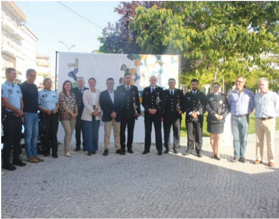
• Entidades que marcaram presença na cerimónia