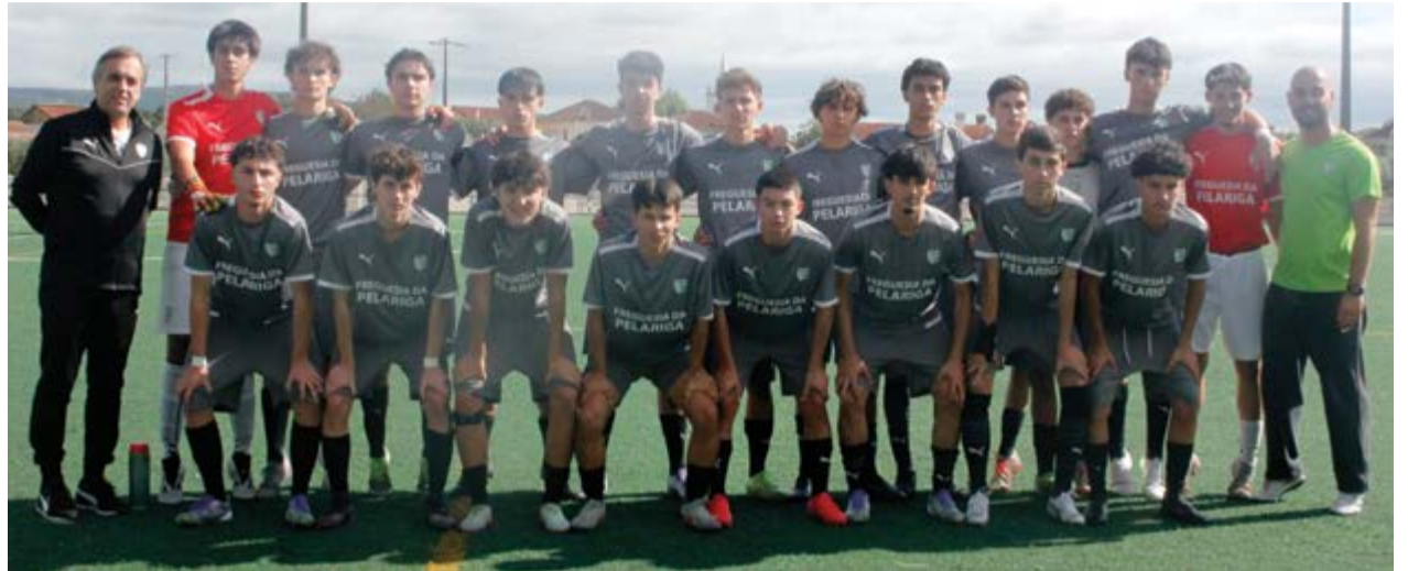
• Formação do Grupo Desportivo da Pelariga que venceu o Vieiraense na primeira jornada

Está dado o lançamento de mais uma época nos escalões de formação das provas distritais, em que decorreu a primeira jornada da divisão de honra.