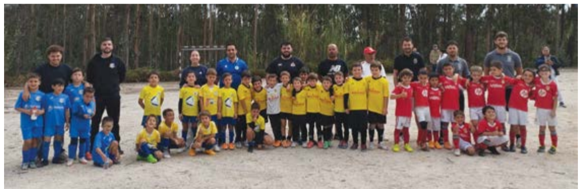
•O torneio de Traquinas 'B' reuniu Caseirinhos, Alegre Unido, Meirinhas e Benfica Escola Leiria