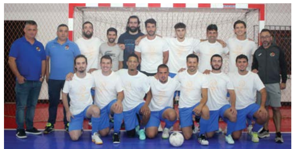
•Formação da freguesia do Carriço que alinhou na primeira jornada