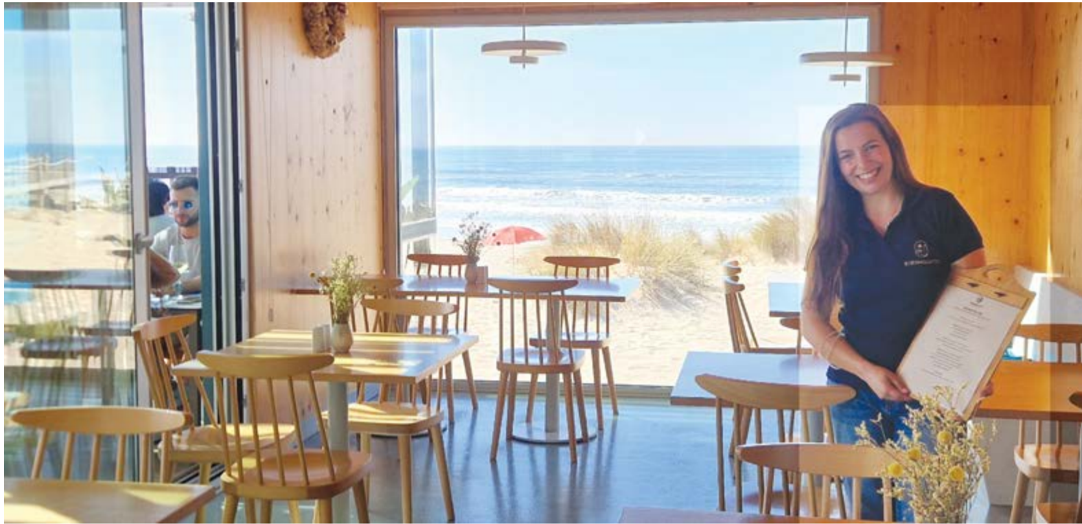
• Inês António fotografada na sala principal do Xiringuito onde sobressai a ampla janela com vista para o mar

Inês António, natural de São Simão de Litém, representa uma geração que quer fazer da restauração não um sacrifício, mas uma escolha. Aos 26 anos, é chefe de sala num conhecido restaurante da Figueira da Foz.