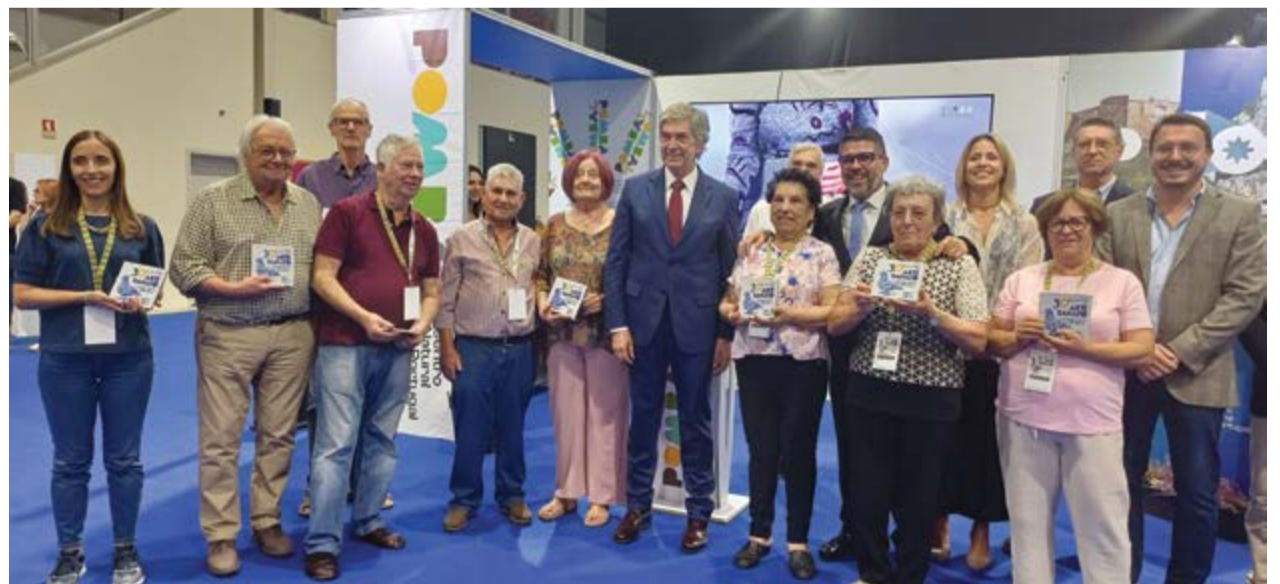
•Artesãos que marcam presença na feira desde a primeira edição foram distinguidos

Este ano, marcaram presença em Pombal cerca de 180 artesãos, oriundos de várias zonas do país. Por sua vez, a vertente gastronómica ficou a cargo de 14 tasquinhas,