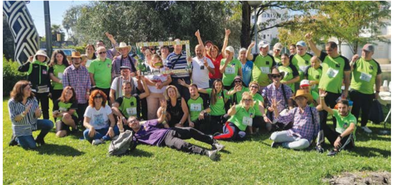
• Grupo de participantes da Cercipom (clientes, técnicos e direcção) no jardim das oliveiras