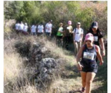
• O Trail iniciou na aldeia do Vale, próximo da associação local e teve passagem pela aldeia de Arroiteia

A Serra de Sicó foi palco de um trail inclusivo, realizado no dia 2 deste mês: o Trail Inter Sicó. A organização foi da Cercipom que, na qualidade de anfitriã, recebeu os mais de 160 participantes, provenientes de várias instituições do distrito de Leiria.