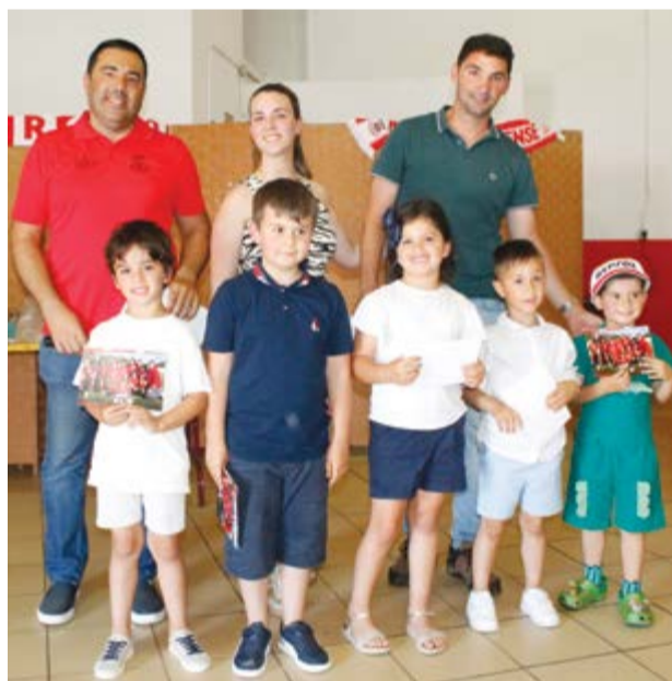
●Os mais novos Petizes / ABC