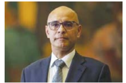
●Candidato tem ligações familiares à Guia, mas reside em Almada

que reside em Almada, “provavelmente, numa outra fase da vida do partido, talvez a dúvida fosse maior”.