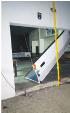
●O homem destruiu o portão com o carro para entrar na associação