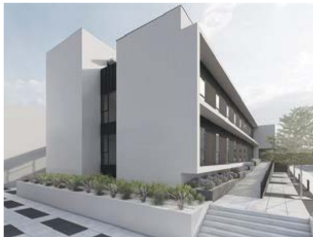
A ampliação do Centro de Saúde de Pombal, investimento de 3.4 milhões de euros, trará melhor capacidade de resposta e dignidade aos utentes

Para além destes investimentos, financiados pelo PRR, o Município irá promover, igualmente, a remodelação e ampliação do Centro de Saúde de Pombal , obra que representa um investimento de 3.4 milhões de euros, que permitirá uma melhor capacidade de resposta e dignidade aos utentes, para além de disponibilizar outras respostas de cuidados de saúde primários.