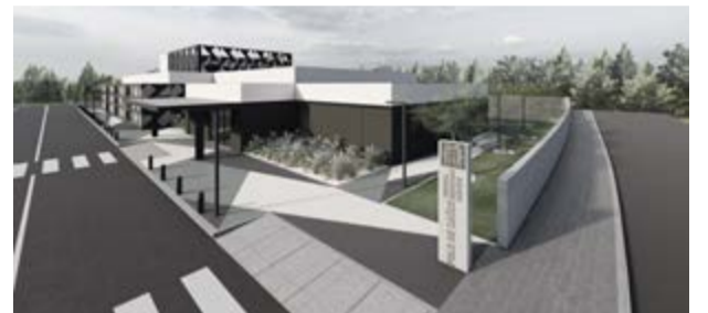
Polo de Saúde de Nossa Senhora da Conceição (no Outeiro da Ranha) servirá as freguesias de Vermoil, Carnide e Meirinhas