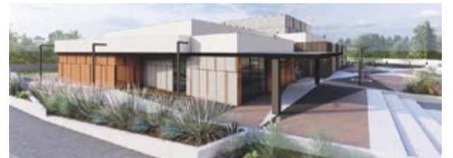
Polo de Saúde de Alitém (em São Simão de Litém) servirá as freguesias de São Simão de Litém, Santiago de Litém e Albergaria dos Doze