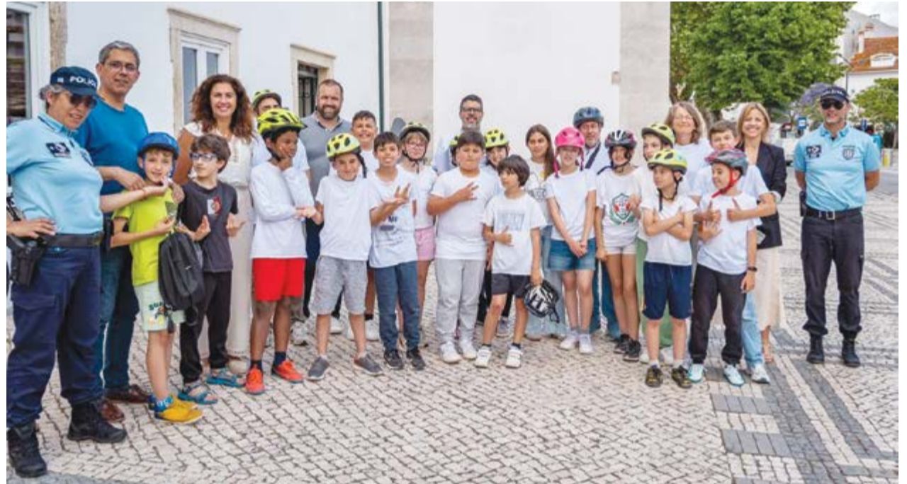
•Turma do 5.º D, da Escola Básica Marquês de Pombal, do Agrupamento de Escolas de Pombal com as entidades

No dia 12 de junho, a nossa turma do 5.º D, da Escola Básica Marquês de Pombal, do Agrupamento de Escolas de Pombal, participou num passeio de bicicleta pelas ruas da cidade, entre a Escola e o açude de Flandes, em meio urbano e utilizando a ciclovia, e que marcou a parte final do trabalho de projeto "Educação Rodoviária e Mobilidade Segura", sobre o qual trabalhámos durante o ano letivo.