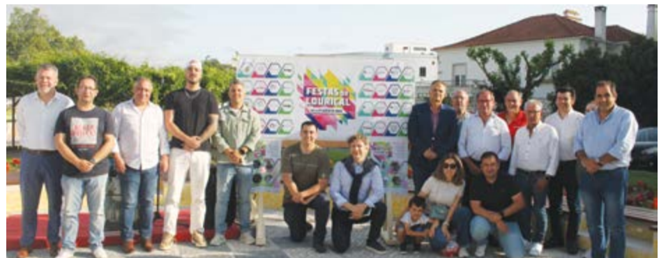
•As festas foram apresentadas na Praça D. Luis Menezes