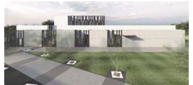
Polo de Saúde Vale do Arunca (no Tinto, na Pelariga) servirá as freguesias da Pelariga, Almagreira e Redinha