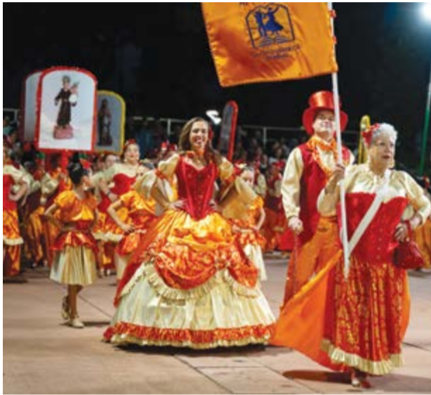
•Actuação da Marcha da Charneca

Pombal assistiu a mais uma exibição das Marchas de Santo António, uma iniciativa que se realiza há mais de 30 anos na cidade. A edição deste ano contou com a participação de cinco grupos marchantes, todos eles oriundos do concelho de Pombal.