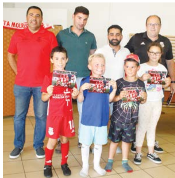
●Treinadores e alguns atletas de Traquinas 'B'