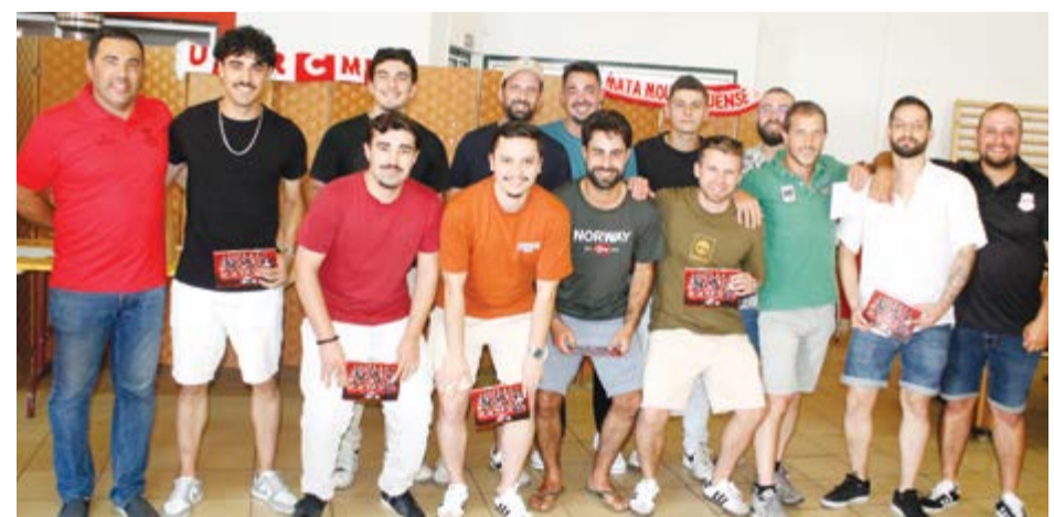
●Equipa sénior que se pautou pela regularidade na zona norte da primeira divisão