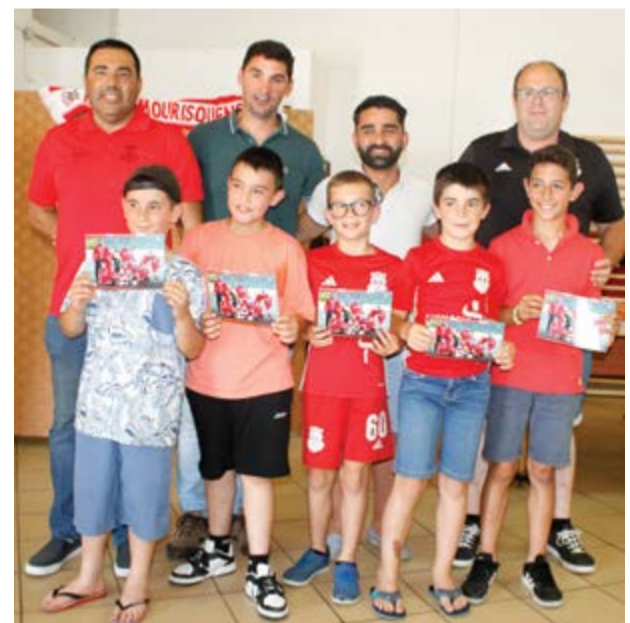
●Alguns dos atletas Benjamins