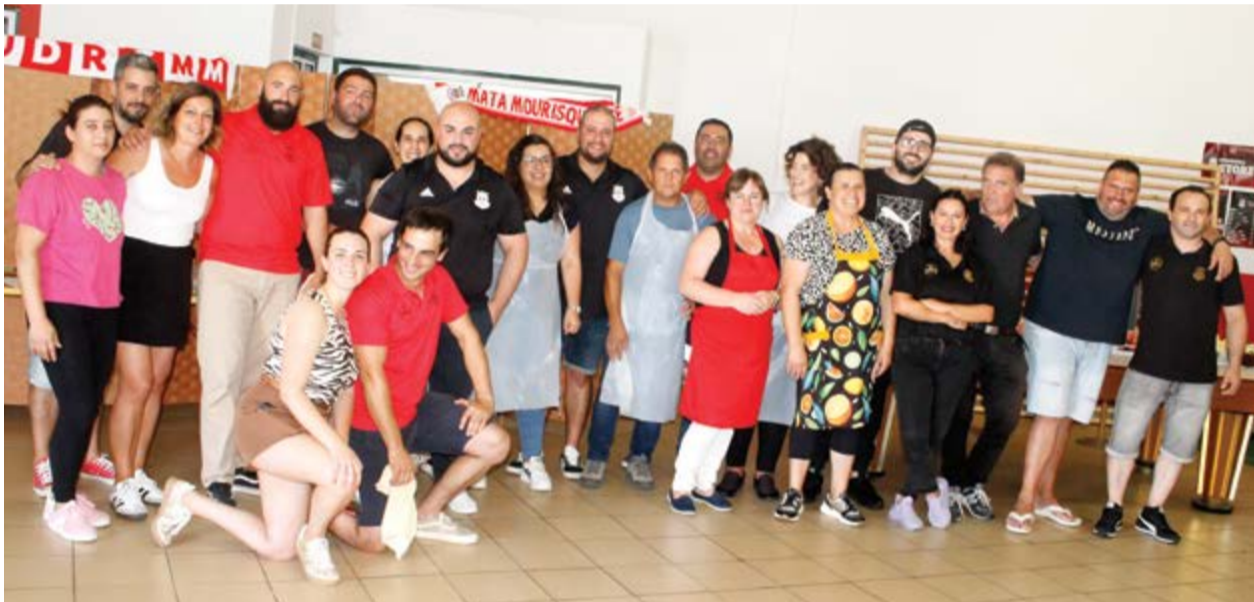
●O grupo de voluntários que preparou e serviu o almoço para mais de 200 pessoas no salão da colectividade