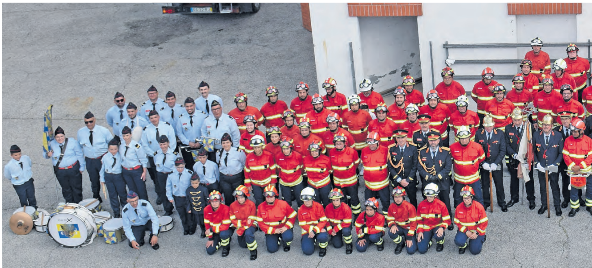
•Actualmente a cooperação conta com 150 Bombeiros no corpo activo. Foto de família da cerimónia de aniversário que decorreu no passado dia 17