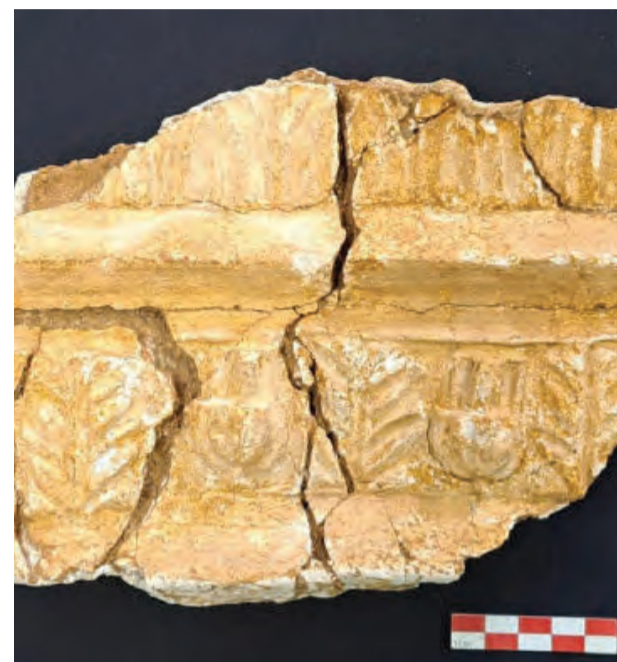
● Baixo-relevo em estuque proveniente da Villa Romana de São Simão, em Penela, passou a integrar a exposição permanente do Museu PO.ROS, em Condeixa

A Villa Romana de São Simão distingue-se, segundo a mesma nota,