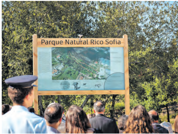
● Parque Rico Sofia ganha novos equipamentos desportivos nas comemorações dos 33 anos da vila do Louriçal

de dar a conhecer uma das zonas características da freguesia, promovendo simultaneamente hábitos de vida saudáveis e o contacto com a natureza.