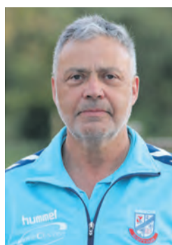
● DIRECTOR ● Carlos Silva