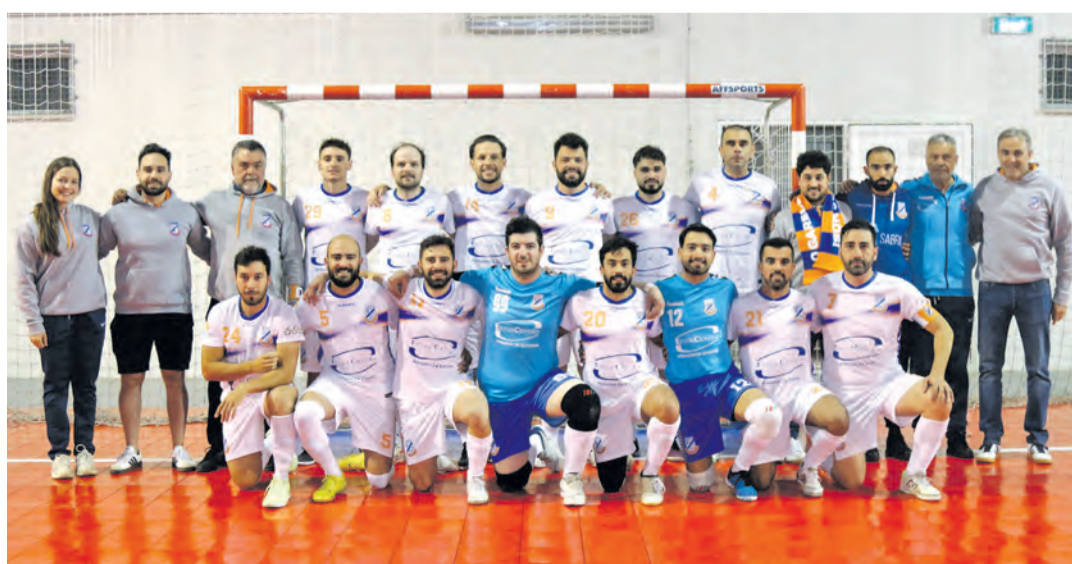
● Formação do GARECUS/Santiais que alinhou no último jogo da época frente ao Ribrafria