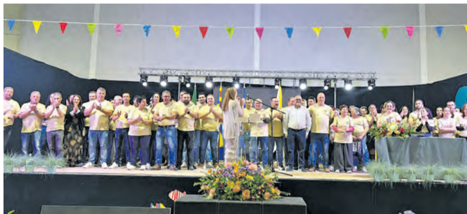
• Todos os voluntários da feira foram chamados ao palco no momento da abertura