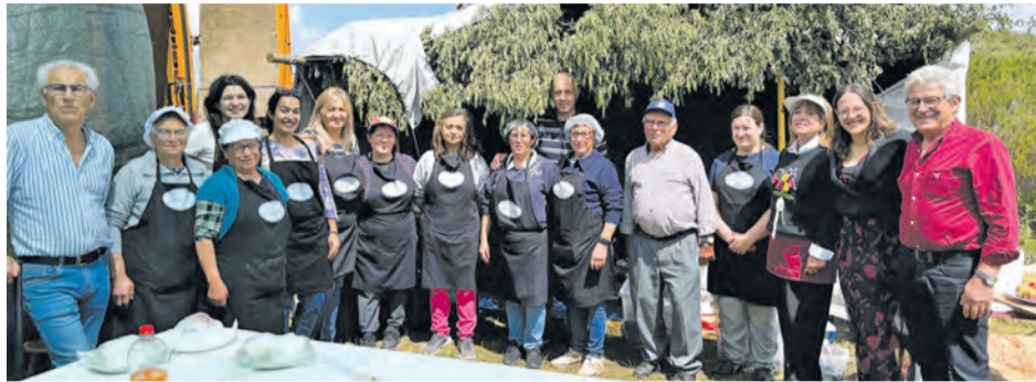
•Os voluntários que colaboraram no almoço convívio

Entre os presentes estiveram a vereadora com o pelouro das Freguesias, Associativismo e Cidadania, da