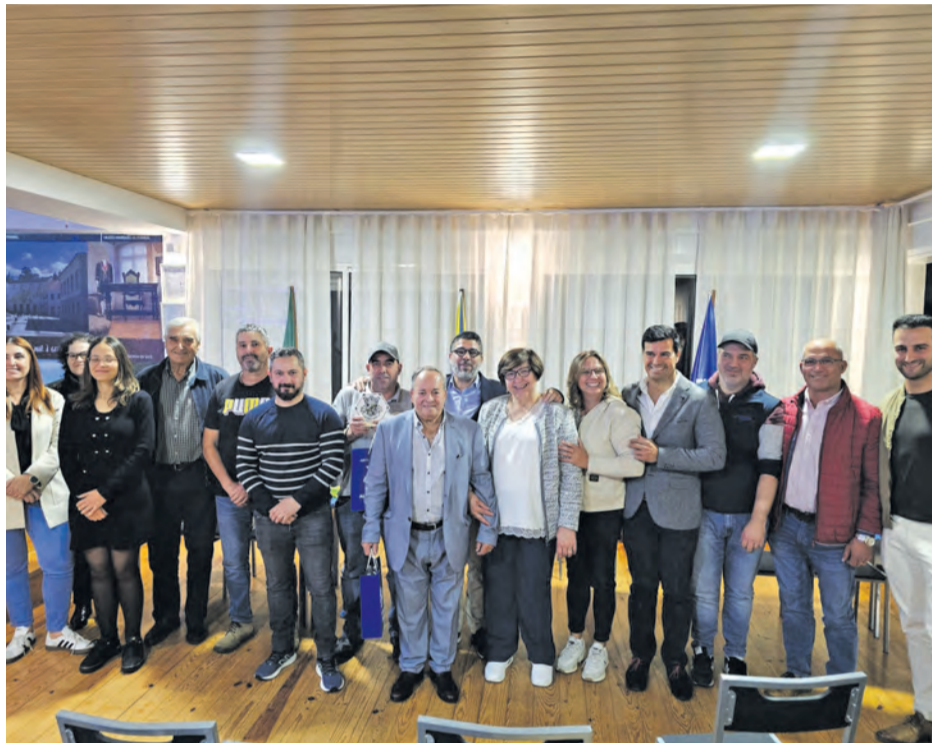
• Novos corpos sociais entraram em funções a 15 de Maio

Em 2000 regressou aos Netos e dedicou-se à criação do actual